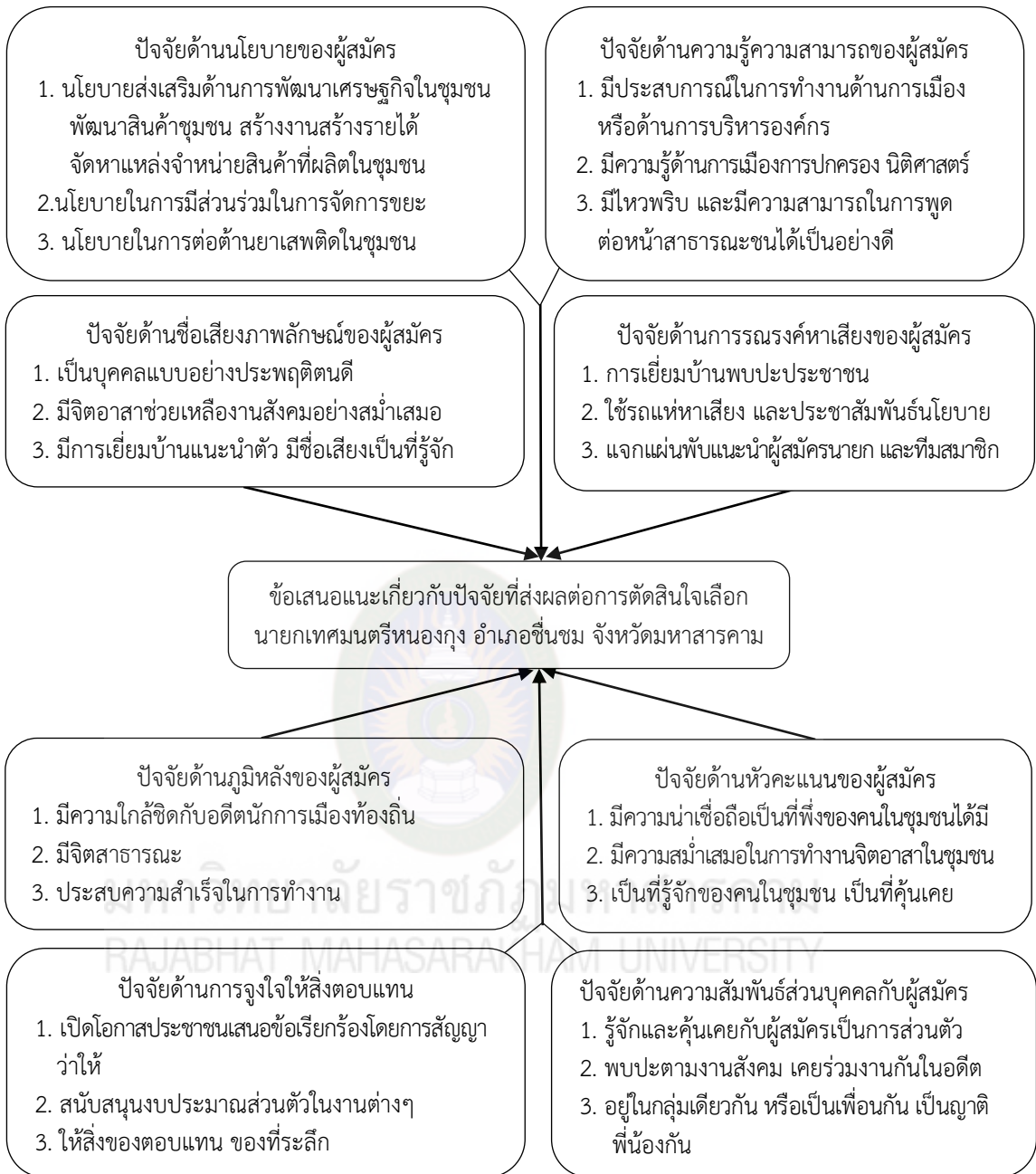
ภาพที่ 4.1 สรุปข้อเสนอแนะเกี่ยวกับปัจจัยที่ส่งผลต่อการตัดสินใจเลือกนายกเทศมนตรีหนองกุ้ง อำเภอชื่นชม จังหวัดมหาสารคาม