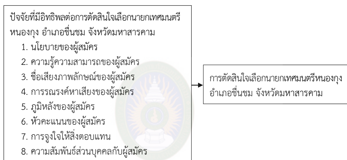
ภาพที่ 2.1 กรอบแนวคิดการวิจัย

การวิจัยเรื่อง ปัจจัยที่ส่งผลต่อการตัดสินใจเลือกนายกเทศมนตรีหนองกุ้ง อำเภอชื่นชม จังหวัดมหาสารคาม โดยผู้วิจัย ได้ทำการสังเคราะห์แนวคิดจากนักวิชาการต่าง ๆ และจากการทบทวนวรรณกรรมเพื่อสร้างกรอบแนวคิด ดังนี้