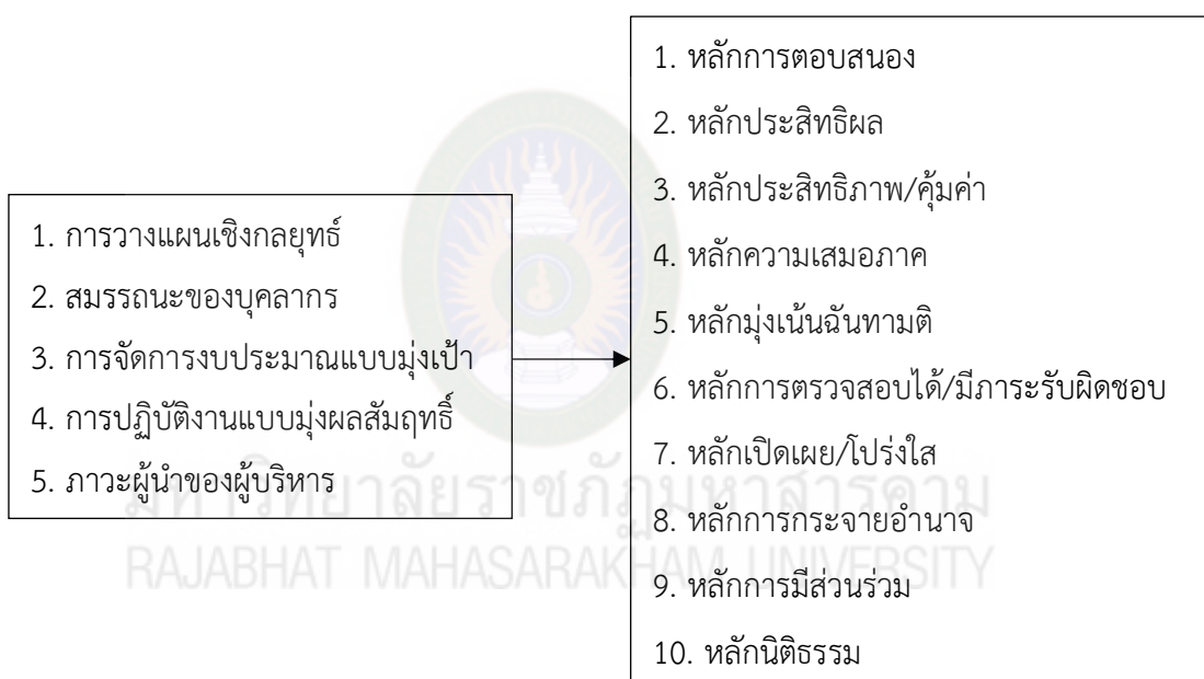
ภาพที่ 2.2 กรอบแนวคิดการวิจัย

จากการทบทวนวรรณกรรมที่เกี่ยวข้อง ตามที่ได้กล่าวมาแล้วข้างต้นสามารถสรุปเป็นกรอบแนวคิดการวิจัยในการศึกษาในครั้งนี้ของ (สำนักงานงาน ก.พ.ร.) หลักการบริหารกิจการบ้านเมืองที่ดี ประกอบด้วย หลัก ได้แก่ หลักการตอบสนอง (Responsiveness) หลักประสิทธิผล (Effectiveness) หลักประสิทธิภาพ/คุ้มค่า (Efficiency/Value for Money) หลักความเสมอภาค (Equity) หลักมุ่งเน้นฉันทามติ (Consensus Oriented) หลักการตรวจสอบได้/มีภาระรับผิดชอบ (Accountability) หลักเปิดเผย/โปร่งใส (Transparency) หลักการกระจายอำนาจ (Decentralization) หลักการมีส่วนร่วม (Participation) และหลักนิติธรรม (Rule of Law)