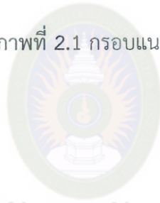
ภาพที่ 2.1 กรอบแนวคิดการวิจัย

มหาวิทยาลัยราชภัฏมหาสารคาม RAJABHAT MAHASARAKHAM UNIVERSITY