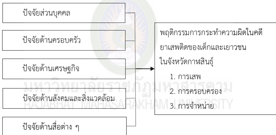
ภาพที่ 2.3 กรอบแนวคิดการวิจัย

การวิจัยเรื่อง ปัจจัยที่ส่งผลต่อการกระทำความผิดในคดียาเสพติดของเด็กและเยาวชน ในจังหวัดกาฬสินธุ์ ผู้วิจัยกำหนดกรอบแนวคิด การวิจัยจากการสังเคราะห์ตัวแปรจากนักวิชาการต่าง ๆ และกำหนดตัวแปรตาม โดยปรับปรุงจากพระราชบัญญัติยาเสพติดให้โทษ พ.ศ. 2522 ดังนี้