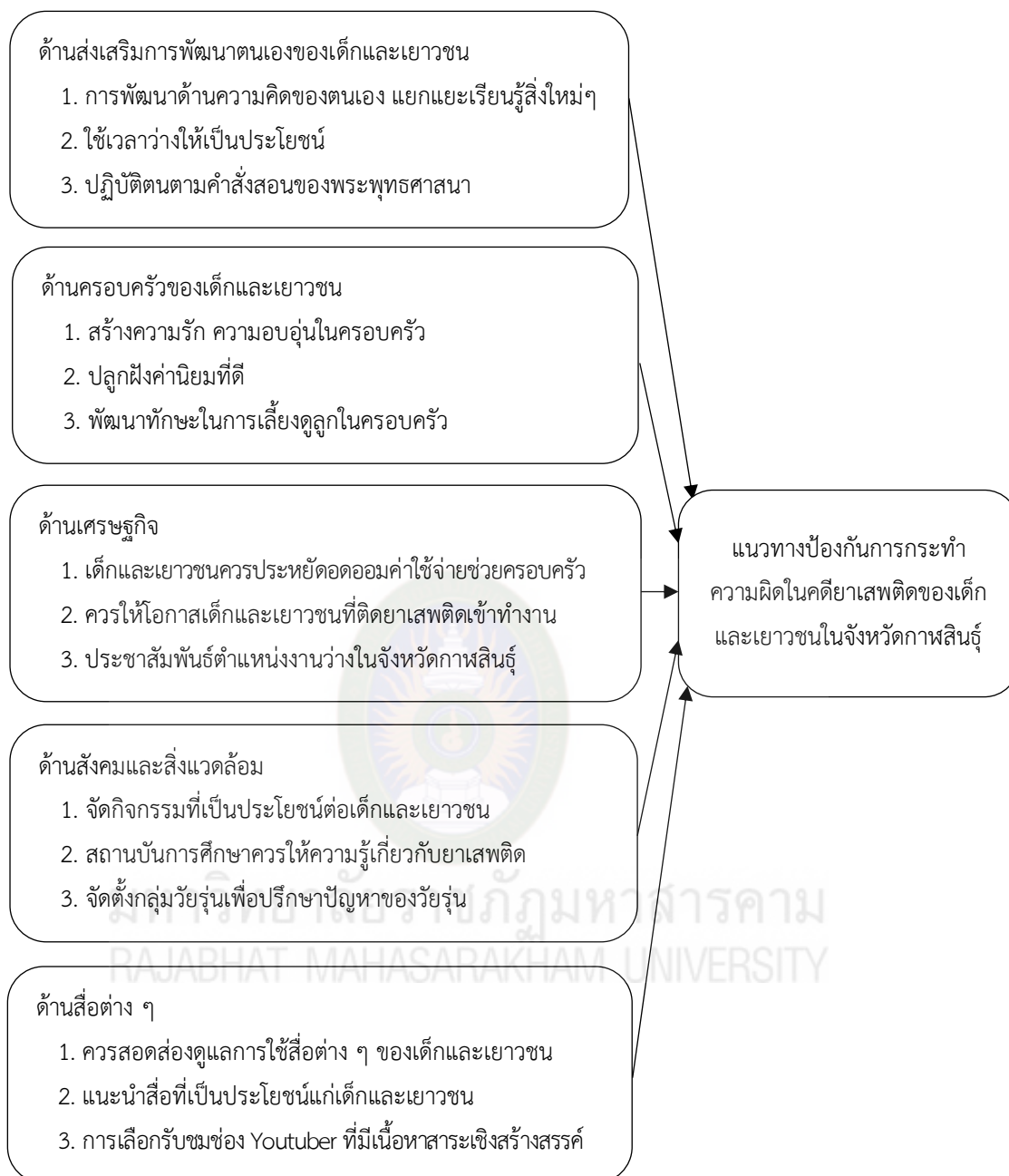
ภาพที่ 4.1 แนวทางป้องกันการกระทำความผิดในคดียาเสพติดของเด็กและเยาวชนในจังหวัดกาฬสินธุ์