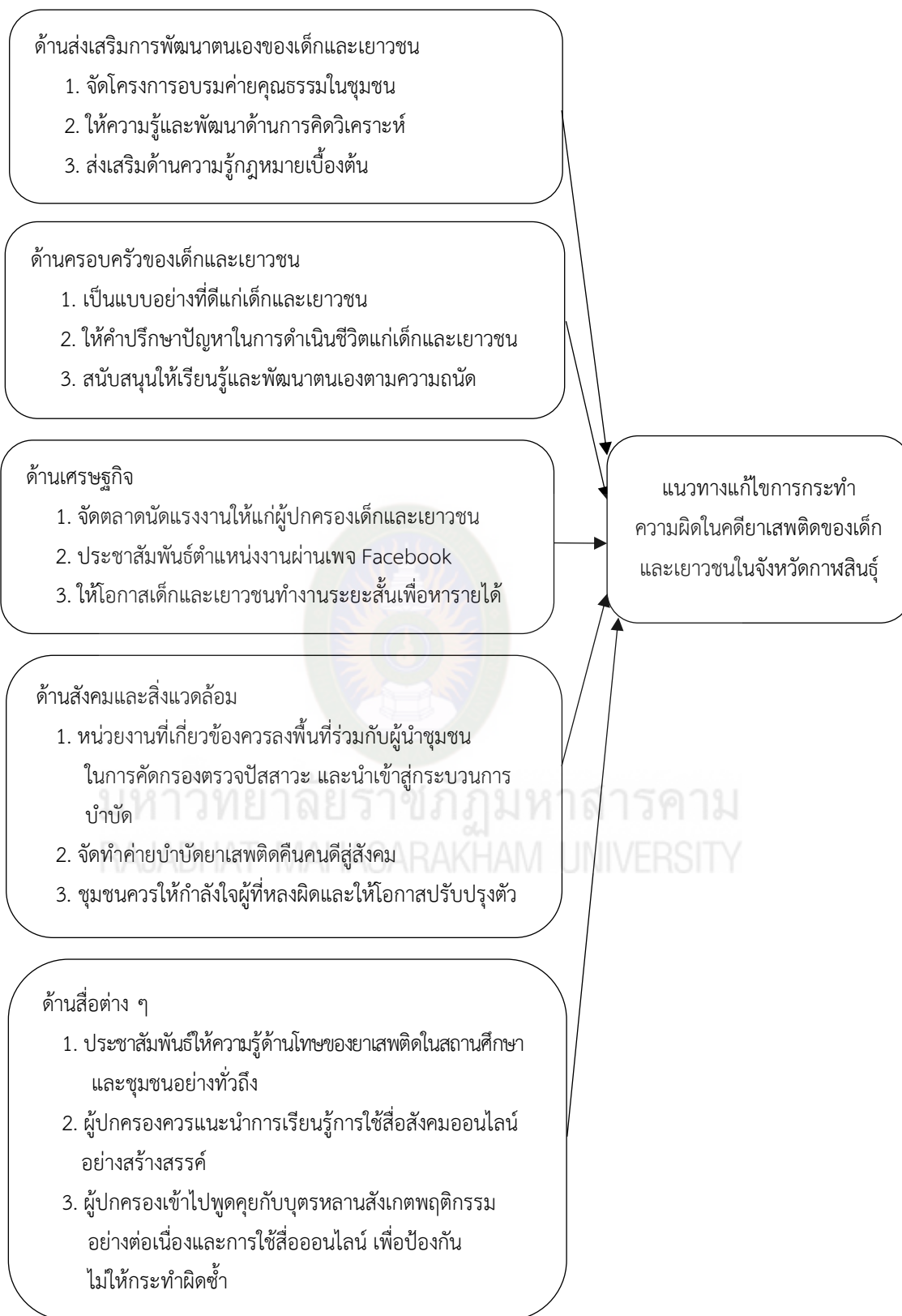
ภาพที่ 4.2 แนวทางการแก้ไขการกระทำ ความผิดในคดียาเสพติดของเด็กและเยาวชนในจังหวัดกาฬสินธุ์