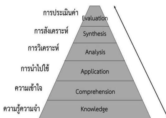
ภาพ 2.1 การเรียนรู้ด้านพุทธิพิสัย (Cognitive Domain) ตามแนวคิดทฤษฎีพัฒนาการเรียนรู้ของบลูม (Bloom)

1.6 การประเมินค่า (Evaluation) เป็นความสามารถในการตัดสินตีราคาหรือสรุปเกี่ยวกับคุณค่าของสิ่งต่าง ๆ ออกมาในรูปของคุณธรรมอย่างมีกฎเกณฑ์ที่เหมาะสมซึ่งอาจเป็นไปตามเนื้อหาสาระในเรื่องนั้น ๆ หรืออาจเป็นกฎเกณฑ์ที่สังคมยอมรับก็ได้