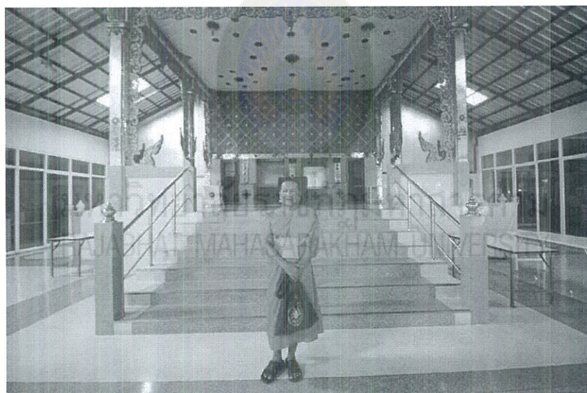
ภาพที่ 4.7 เมรุวัดสน

วัดสน ปัจจุบันมี พระครูปลัดนายกวรวัดน์ เป็นเจ้าอาวาส มีศาลาบำเพ็ญกุศล จำนวน 4 หลัง มีเมรุเผาศพ จำนวน 1 หลัง เป็น เตาน้ำมัน มีพนักงาน/คนงาน/สัปเหร่อ รวม 3 คน จำนวนศพต่อเดือน ประมาณ 5 ศพ อัตราค่าศาลาบำเพ็ญกุศล ศาลา 1-4 พัดลม คีนละ 1,000 บาท วันเผา 1,000 บาท ศาลาเครื่องปรับอากาศ คีนละ 1,500 บาท วันเผา 1,500 บาท ค่าน้ำมันเตาเผาศพ 2,500 บาท ค่าบริการ พนักงาน/คนงาน 4,000 บาท/งาน (เหมาจ่ายคนงาน 3 คน) ค่าสัปเหร่อ วันเผา 1,500 บาท/งาน ค่าหีบศพ 5000 บาท ค่าอาหารว่าง กล่องละ 28-45 บาท อาหารเลี้ยงพระ วันเผา หัวละ 250 บาท/คน ค่าดอกไม้ 3,500 บาท ค่าพวงหรีด 800 บาท ค่าช่องเก็บอัฐิ บนมณฑป 50,000 บาท ค่าผ้าไตรชุดละ 200 นอกจากนี้ วัดยังจัดให้มีสวัสดิการคนงาน เดือนละ 3000 บาทต่อคน