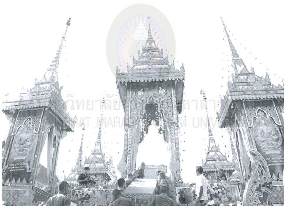
ภาพที่ 4.17 การฌาปนกิจศพที่วัดสารอด

เนื่องด้วยการฌาปนกิจศพเป็นงานที่สำคัญมาก สิ่งของต่าง ๆ ที่จะต้องเตรียมการใน dki ฌาปนกิจศพ ประกอบด้วย ผ้าไตรทอดบังสุกุล ดอกไม้จันทน์ นิมนต์พระสงฆ์ 4 รูปสวดหน้าไฟ ปัจจัย และไทยธรรมถวายพระสวดหน้าไฟ การประกอบพิธี เมื่อได้เวลา ท่านผู้ประธานในพิธีขึ้นไปทอดผ้าไตรบังสุกุลบนเมรุ เคารพศพแล้วรับผ้าไตรบังสุกุลที่รับมาจากเจ้าภาพหรือเจ้าหน้าที่วางขวางบนภูเขาโยงบนพานแล้วเลี้ยงไปยืนอยู่ข้าง ๆ ประนมมือ เมื่อพระสงฆ์มาชักผ้าบังสุกุล จากนั้น รับกระทงขมาศพวางไว้ใต้หีบศพด้านศีรษะศพ (ถ้ามี) รับดอกไม้จันทน์จุดที่ตะเกียงแล้ววางไว้ใต้หีบศพ เคารพศพ แล้วลงจากเมรุ จากนั้นผู้ร่วมพิธีทยอยขึ้นไปวางดอกไม้จันทน์จนเสร็จสิ้น รอเผาจริง