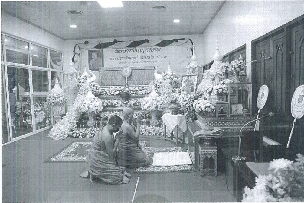
ภาพที่ 4.12 สถานที่ตั้งศพ