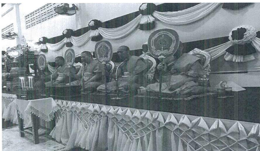
ภาพที่ 4.15 พระสงฆ์สวดพระอภิธรรม

การสวดพระอภิธรรม นิยมสวดในเวลากลางคืน ให้จัดที่สำหรับพระสงฆ์สวด 4 รูป สถานที่ให้ตั้งตู้พระอภิธรรม แจกัน เชิงเทียน กระจกธูป การจัดพิธีบำเพ็ญกุศลสวดพระอภิธรรม ประจำคืนนั้น นิยมจัดพิธีตั้งแต่วันตั้งศพเป็นต้นไปทุกคืน นิยมสวด 3 คืน 5 คืน หรือ 7 คืน ตามปกติ จะเริ่มตั้งแต่เวลา 19.00 น. ถ้าผู้ตายเป็นข้าราชการผู้ใหญ่ หรือเป็นที่เคารพนับถือของคนทั่วไป นิยมเปิดโอกาสให้มีการจองเป็นเจ้าภาพบำเพ็ญกุศลอุทิศให้แก่ท่านผู้ล่วงลับไปแล้ว เพื่อเป็นการแสดงความกตัญญูตเวทีต่อท่านผู้มีพระคุณหรือมีอุปการคุณแก่ตน ตามประเพณีนิยมของสังคม