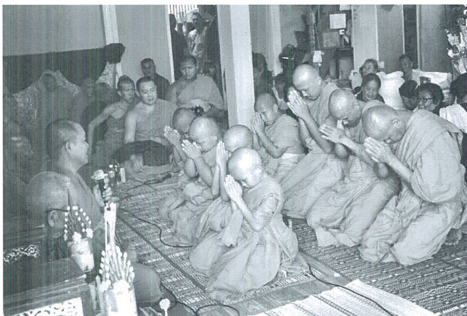
ภาพที่ 4.18 การบวชน้ำไฟ