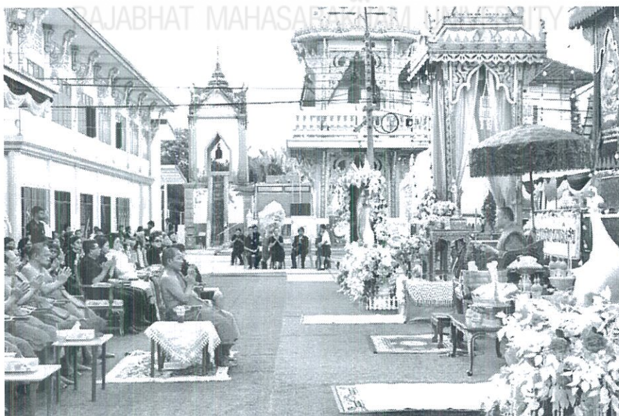
ภาพที่ 4.19 การแสดงพระธรรมเทศนาในงานศพ

การมีพระธรรมเทศนา คือ การนิมนต์พระสงฆ์มาแสดงธรรมในวันที่จะบรรจุศพหรือวันที่จะทำการฌาปนกิจศพ ซึ่งตามปกติจะจัดขึ้นในตอนบ่าย โดยในตอนเช้าเจ้าภาพจะต้องจัดเตรียมภัตตาหารเพลถวายพระสงฆ์ เสร็จแล้ว ตอนบ่ายก็มีการแสดงพระธรรมเทศนา