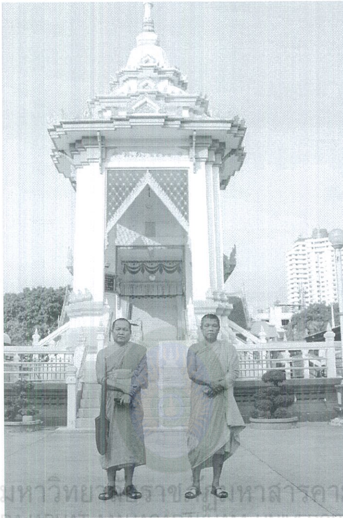
ภาพที่ 4.4 เมรุวัดบางปะกอก