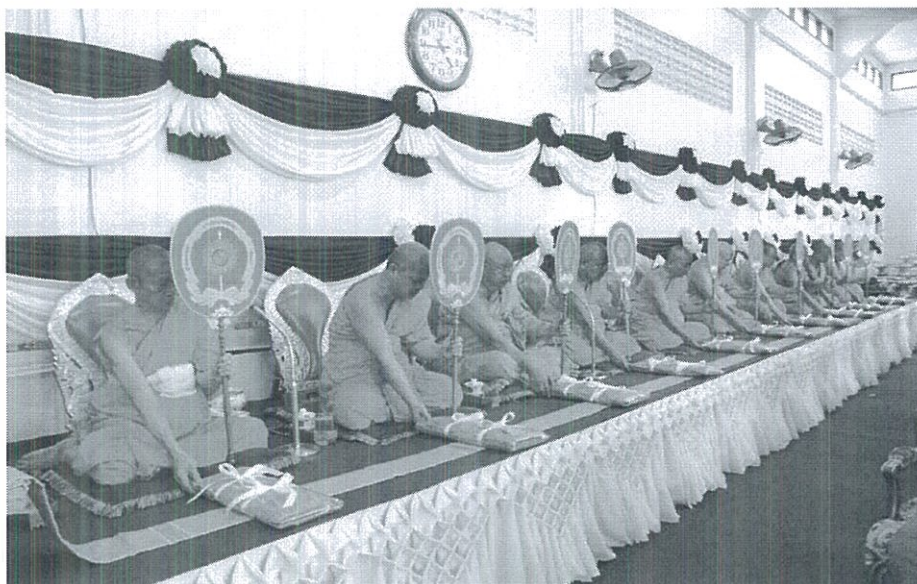
ภาพที่ 4.14 การจัดพิธีบำเพ็ญกุศลบังสุกุลปากหีบ