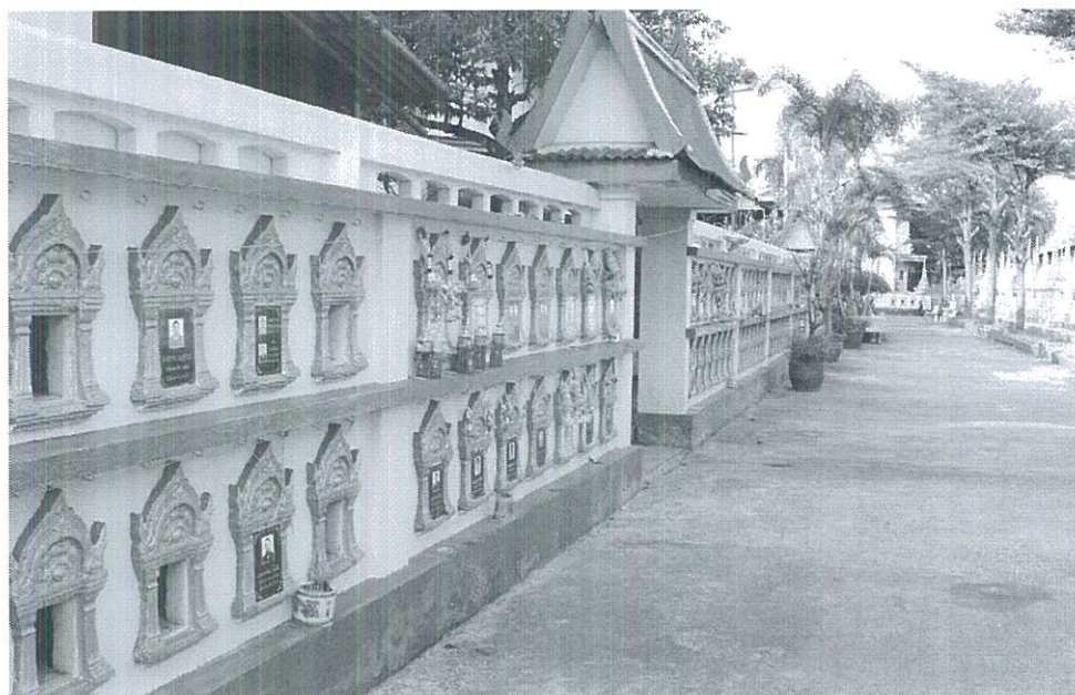
ภาพที่ 4.23 ที่บรจจธัฎว้ฎรชฎฎัฎรณะ