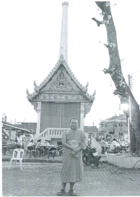
ภาพที่ 4.2 เมรุวัดเกียรติประดิษฐ์