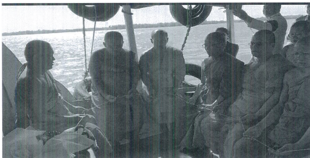
ภาพที่ 4.24 การลยอ้งคอร

การลยอ้งคอร ค้อการนำอฐัฎไปลยอ้งคอรในแม่่น้ำหรือทะเล ญวติจะต้อจ้ฎคอรด้วยตนเอง โดยจะต้อจ้ฎรูปเทยงบชชว แล้วจ้ฎหยอ้งคอรน้ลงในแม่่น้ำหรือทะเล พร้อมคอกไม้รูปเทยง ตามลงไปในที่ลยอ้งคอรน้ด้วยความคอรระรอยอฐัฎลงไปในที่ลยอ้งคอรก็ได้ เหตุที่ลยอ้งคอร หลังจากคอรบณกจคคพ แล้วเพราะเช้อก้นว่ คนเรากจ้ฎจกจธชฎ เมื่อต้อคตบแล้วก็คอร ให้กลับปออยู่ในสภวคเดิม