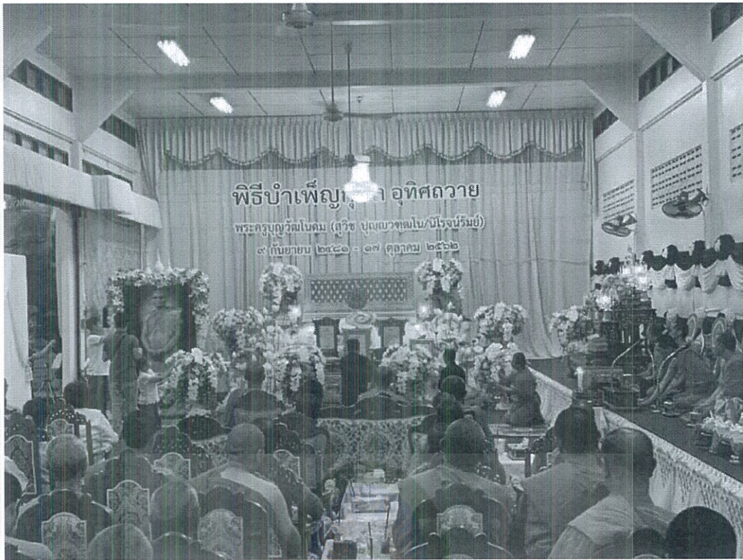
ภาพที่ 4.13 สถานที่ตั้งรูปของผู้ตาย