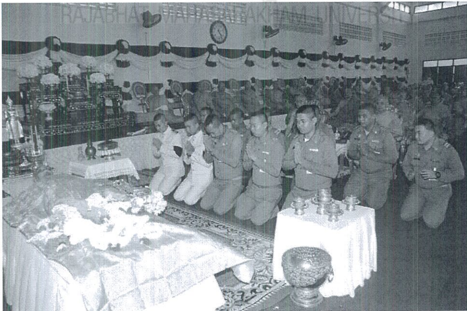
ภาพที่ 4.11 การบรรจุศพ