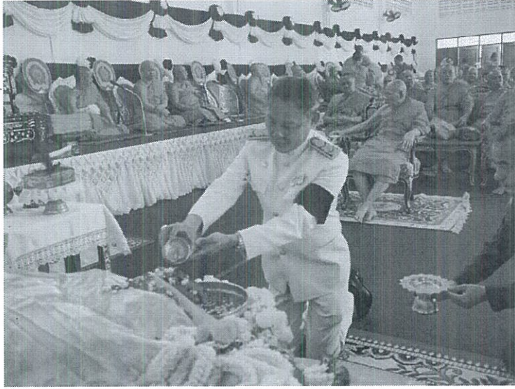
ภาพที่ 4.10 การรดน้ำศพ