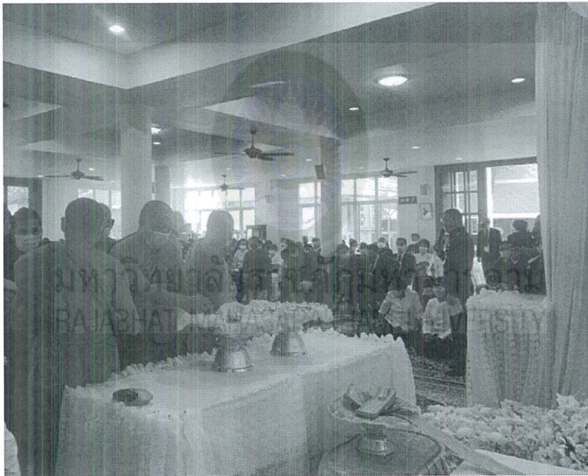
ภาพที่ 4.16 การบรรจุศพ

เมื่อเจ้าภาพได้บำเพ็ญกุศลศพครบ 3 วัน 7 วัน 50 วัน หรือ 100 วัน แล้วยังไม่ทำการฌาปนกิจ จะต้องเก็บไว้เพื่อรอญาติหรือรอโอกาสอันเหมาะสมจึงจะทำพิธีฌาปนกิจต่อ จะเก็บศพไว้ที่บ้านหรือที่วัดก็สุดแล้วแต่สะดวก ถ้าเก็บไว้ที่วัด ก็นิยมการบรรจุศพ โดยพิธีบรรจุศพ เมื่อเจ้าภาพบำเพ็ญกุศลตามจำนวนวันที่กำหนดไว้แล้ว พอได้เวลาก็นำศพไปยังสถานที่บรรจุ นำหีบศพเข้าที่เก็บ แต่ยังไม่ปิดที่เก็บ เชิญแขกเข้าเคารพศพตามลำดับ โดยเจ้าภาพจะนำดินเหนียวก้อนเล็ก ๆ ห่อกระดาษสีเงินสีทอง หรือเป็นสีขาวสีดำใส่ถาดไว้ เพื่อแจกแขกคนละก้อน จะมีดอกไม้ด้วยก็ได้ เมื่อก่อนนำดินเหนียวและดอกไม้ ไปวางเคารพศพแล้ว เจ้าภาพก็ทอดผ้าบังสุกุลที่ปากหีบศพและนิมนต์พระสงฆ์ชักผ้าบังสุกุลแล้วก็เก็บศพเป็นอันเสร็จพิธี