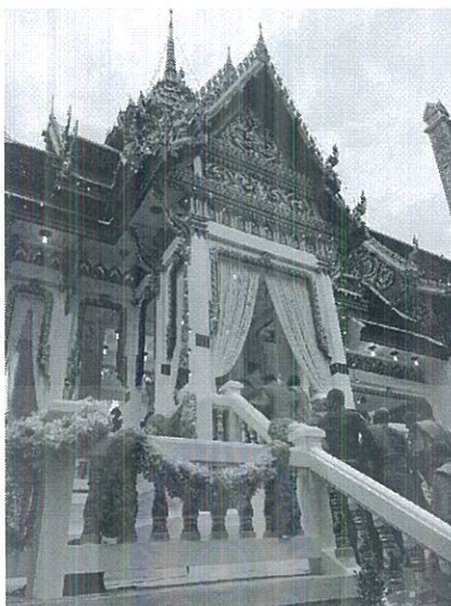
ภาพที่ 4.3 เมรุวัดแจรงร้อน

อัตราค่าศาลาบำเพ็ญกุศล ศาลา 1-3 พัดลม คืนละ 1,000 บาท เครื่องปรับอากาศ คืนละ 1,500 บาท ค่าน้ำมันในการเผาศพ เจ้าภาพจัดซื้อน้ำมันดีเซล 90 ลิตร ค่าบริการ พนักงาน/คนงาน วันละ 200 บาท/คน และค่าสัปเหร่อวันเผา 1,500 บาท/งาน มีค่าใช้จ่ายในการบรรจุช่องเก็บอัฐิ ประมาณ 500-3,000 บาท และเจดีย์บรรจุอัฐิ 10,000 บาท ส่วนผ้าไตร เครื่องไทยธรรม ตามกำลังศรัทธา