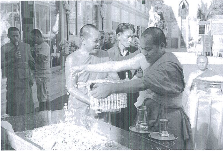
ภาพที่ 4.22 การเก็บอัฐิ