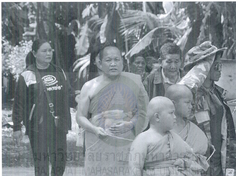
ภาพที่ 4.20 เคลื่อนศพไปสุเมรุ

การเคลื่อนศพต้องนิมนต์พระสงฆ์ 1 รูป เวียนรอบเมรุ 3 รอบการเวียน ต้องเวียนจากขวาไปซ้าย เจ้าภาพและญาติของผู้ตายต้องเดินเข้าขบวนตามศพเวียนรอบเมรุด้วยในขบวน โดยมีพระสงฆ์เป็นผู้นำ มีคนถือเครื่องทองน้อย หรือกระถางธูปหน้าศพ เมื่อนำศพเวียนรอบเมรุครบ 3 รอบแล้ว ก็นำศพขึ้นตั้งบนเมรุ