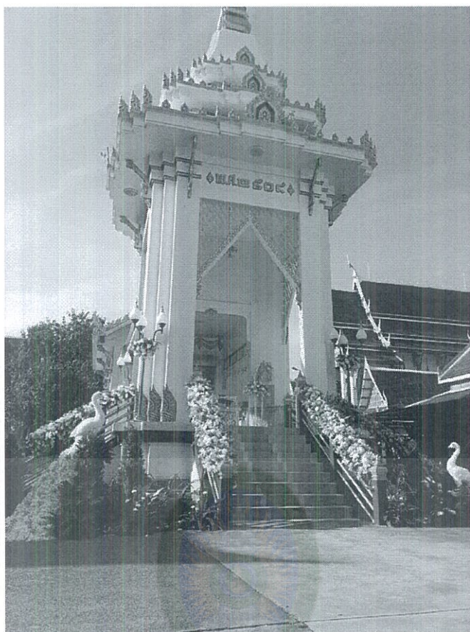
มหาวิทยาลัยราชภัฏมหาสารคาม ภาพที่ 4.8 แมรุวัดสารอด RAJABHAT MAHASARAKHAM UNIVERSITY