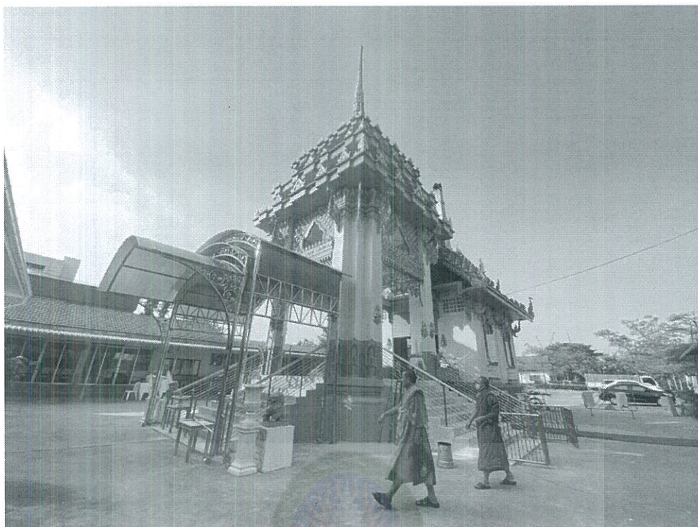
ภาพที่ 4.6 เมรุวัดราชบุรณะ