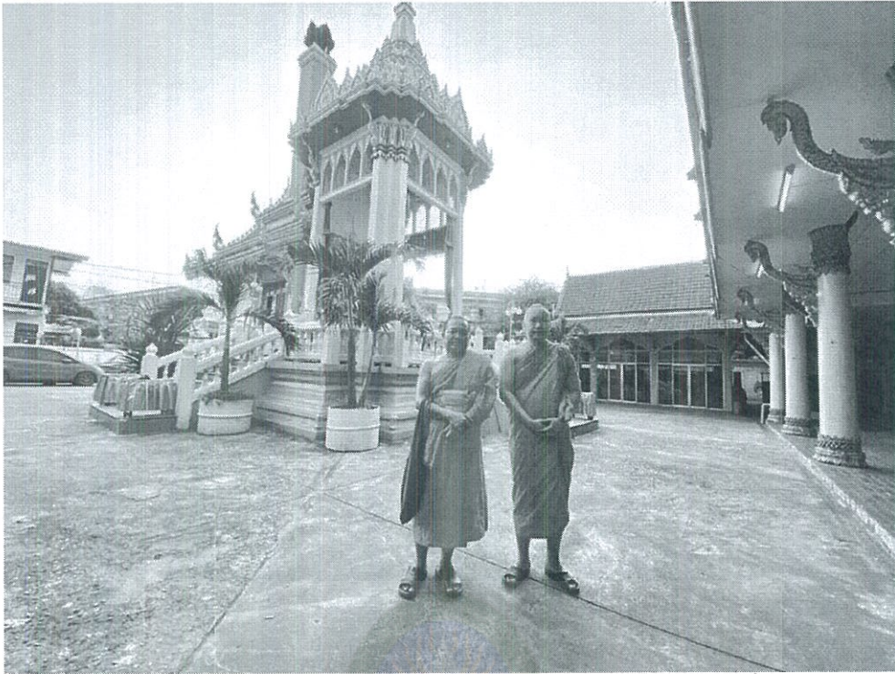
ภาพที่ 4.5 เมรุวัดประเสริฐสุทธาวาส