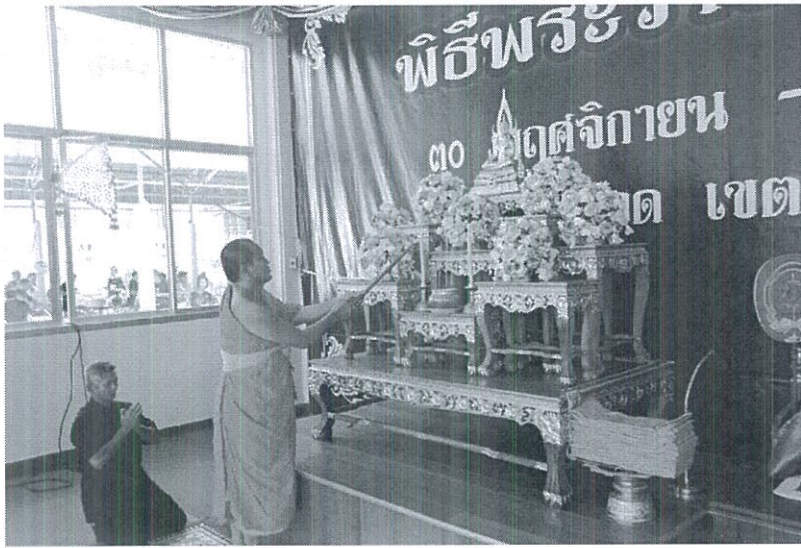
ภาพที่ 4.9 การตั้งโต๊ะหมู่บูชา