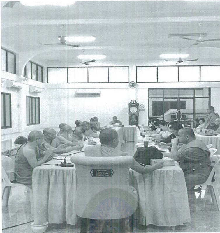
ภาพที่ 4.1 ประชุมกลุ่ม ณ วัดสารอด