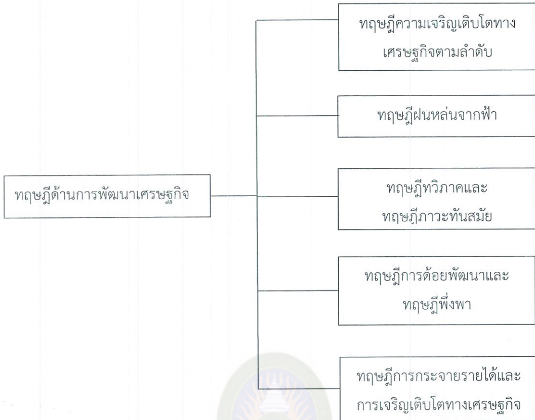
ภาพที่ 2.3 ทฤษฎีด้านการพัฒนาเศรษฐกิจ