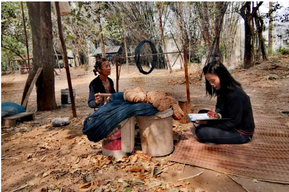
ภาพที่ จ.2 ลงพื้นที่เก็บข้อมูลแบบสัมภาษณ์ ประชาชนชุมชนเกี่ยวกับท่องเที่ยวเชิงวัฒนธรรมของตำบลดินจี่