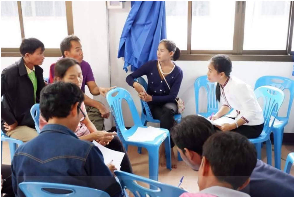
ภาพที่ จ.1 ลงพื้นที่เก็บข้อมูลแบบสัมภาษณ์ เกี่ยวกับการท่องเที่ยวเชิงวัฒนธรรมของตำบลดินจี่