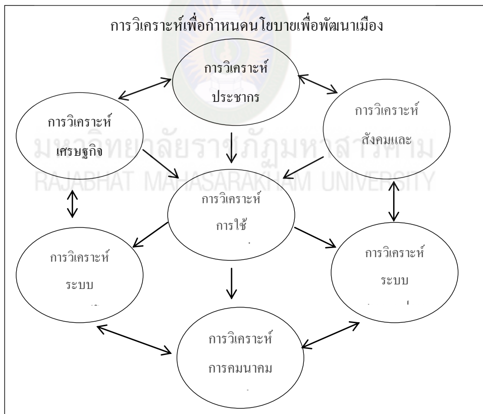
ภาพที่ 2.1 การวิเคราะห์ข้อมูลเพื่อการวางผังเมืองรวมและความสัมพันธ์เชื่อมโยงของการวิเคราะห์แต่ละด้าน

การวิเคราะห์ข้อมูลเพื่อวางผังเมืองเป็นการศึกษาจากการวิเคราะห์สถานการณ์บ้านเมือง เพื่อให้ทราบสถานะทางการปกครอง เศรษฐกิจ สังคม ประชากร การบริการสาธารณูปโภคและสาธารณูปการ รวมถึงการวิเคราะห์การใช้ประโยชน์ที่ดินให้มีความสัมพันธ์และเชื่อมโยงกับโครงข่ายคมนาคมและการขนส่งอย่างมีประสิทธิภาพ เพื่อให้สามารถคาดการณ์แนวโน้ม การเจริญเติบโตของเมืองให้สอดคล้องกับการเปลี่ยนแปลงในสังคมปัจจุบันและอนาคต (กรมโยธาธิการและผังเมือง, 2551 น. 4) และเพื่อการพัฒนาเมืองอย่างยั่งยืนผังเมืองรวมควรได้รับการวางและจัดทำอยู่บนพื้นฐานการร่วมกันของทุกภาคส่วน และบนพื้นฐานของการเป็นสาธารณะหรือเป็นส่วนรวม 3 ประการ อันได้แก่ ความปลอดภัยสาธารณะ (Public Safety) สุขอนามัยสาธารณะ (Public Health) และความเป็นอยู่ที่ดีสาธารณะ (Public Welfare) Pujinda (2013, อ้างถึงใน พนิต ภูจินดาและ ชสพล บุญสม, 2559, น. 28)