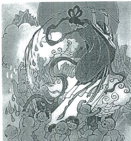
ภาพที่ 1.2 女媧造人