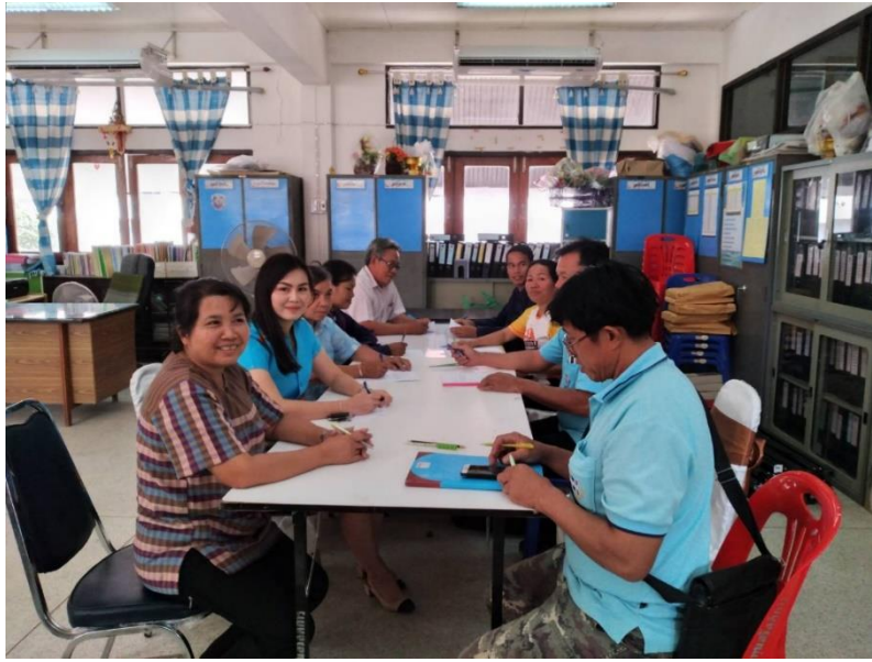
ภาพที่ จ.1 จัดประชุมเชิงปฏิบัติการ / การสนทนากลุ่ม โดยเชิญ กำนัน ผู้ใหญ่บ้าน แพทย์ประจำตำบล สารวัตรกำนัน ผู้ช่วยผู้ใหญ่บ้าน ประธานเครือข่ายกองทุนหมู่บ้านอำเภอไทยเจริญ และ คณะกรรมการหมู่บ้านในพื้นที่อำเภอไทยเจริญ