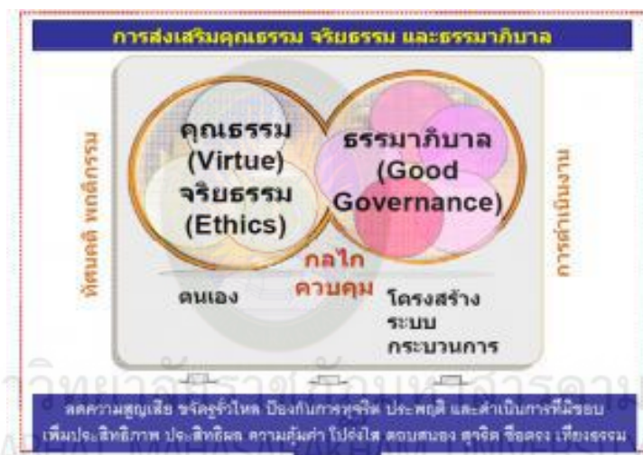
ภาพที่ 2.1 โครงสร้างหลักธรรมาภิบาล

แต่ไม่ว่าธรรมชาติจะแตกแขนงออกไปมากมายเพียงใด หรือจะมีที่มาจากไหน แต่สิ่งหนึ่งที่เราต้องยอมรับคือขณะนี้ประเทศไทยกำลังอยู่ในภาวะวิกฤต ซึ่งเป็นผลมาจากความฉ้อฉลของกลุ่มคนเพียงกลุ่มเดียวที่สร้างภาระและผลกปัญหาทำให้ประชาชนทุกคนต้องร่วมกันรับผิดชอบ ดังนั้นการที่จะฟันฝ่าวิกฤตไปได้ทุกฝ่ายจะต้องช่วยกันแก้ไขการสร้างความระบบการเมือง การบริหารที่ปลอดจากการแฉล จึงเป็นสิ่งจำเป็น ธรรมชาติจึงเป็นสิ่งที่เหมาะสมผลักดันให้เกิดขึ้น แต่จะเป็นรูปแบบใดต้องเป็นสิ่งที่ช่วยกันพิจารณาอีกครั้งหนึ่ง