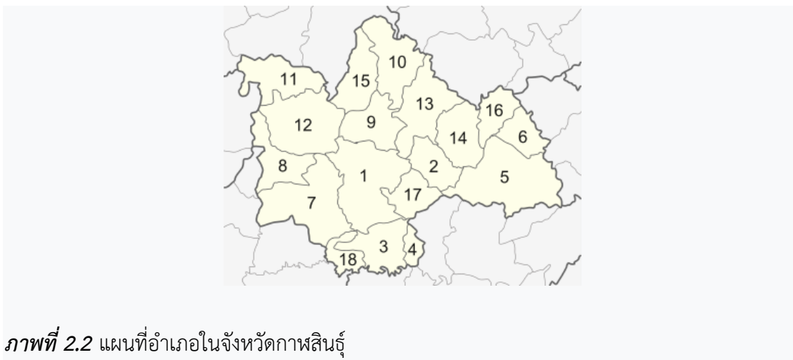
ภาพที่ 2.2 แผนที่อำเภอในจังหวัดกาญจนบุรี

การปกครองแบ่งออกเป็น 18 อำเภอ 135 ตำบล 1,584 หมู่บ้าน ดังนี้