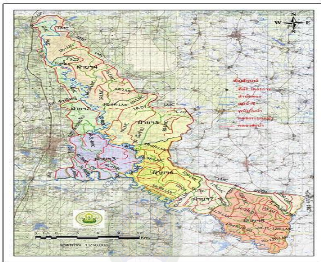
ภาพที่ 6.2 แผนที่โครงการส่งน้ำและบำรุงรักษาหนองหวาย