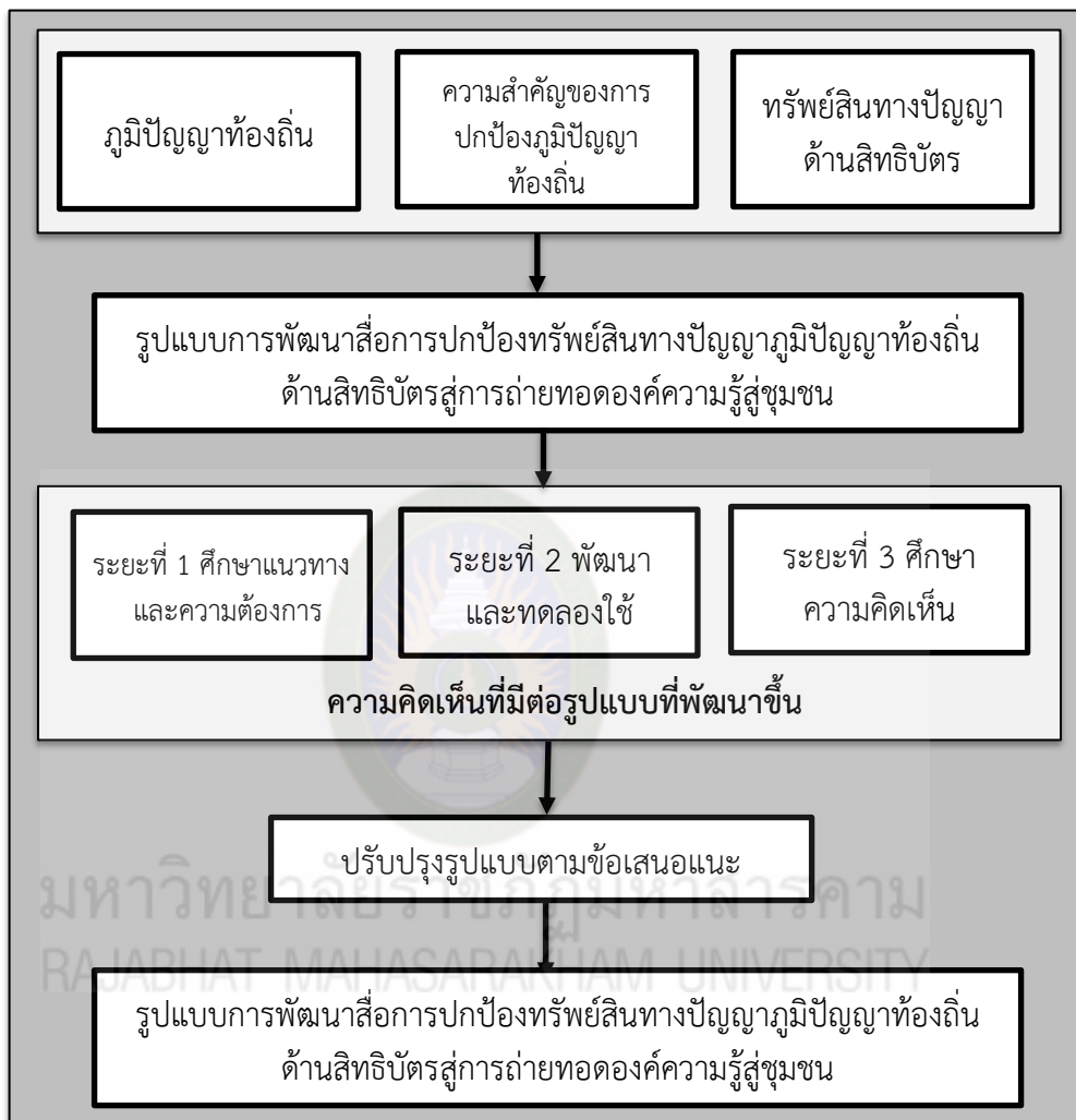
ภาพที่ 1.1 กรอบแนวคิดการวิจัย

จากภาพที่ 1.1 เป็นกรอบแนวคิดการวิจัยแสดงให้เห็นว่ากรอบแนวคิดการวิจัยเกิดจากการศึกษาถึงกฎหมายท้องถิ่น ความสำคัญของการปกป้องกฎหมายท้องถิ่น และทรัพย์สินทางปัญญา เมื่อศึกษาความสำคัญของแต่ละองค์ประกอบแล้วจึงพัฒนาเป็นรูปแบบของการพัฒนาสื่อการปกป้องทรัพย์สินทางปัญญาท้องถิ่นด้านสิทธิบัตรสู่การถ่ายทอดองค์ความรู้สู่ชุมชน เมื่อได้รูปแบบแล้วจึงพัฒนาสื่อแล้วดำเนินตามแผนที่ได้วางไว้ทั้ง 3 ระยะ จากนั้นเข้าสู่กระบวนการปรับปรุงตามความคิดเห็นแล้วจึงได้รูปแบบที่สมบูรณ์ของการพัฒนาสื่อการปกป้องทรัพย์สินทางปัญญาท้องถิ่นด้านสิทธิบัตรสู่การถ่ายทอดองค์ความรู้สู่ชุมชน