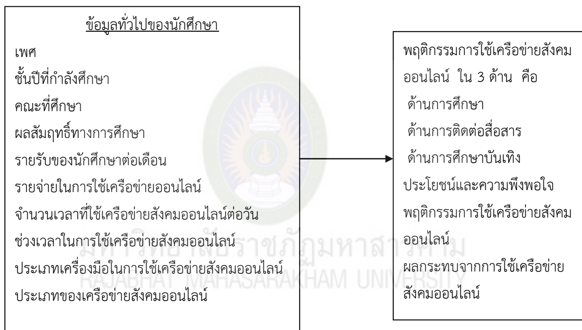
ภาพที่ 2.1 แสดงกรอบแนวคิดในการวิจัย

สำหรับการวิจัยครั้งนี้มีกรอบแนวคิดในการศึกษาพฤติกรรมการใช้เครือข่ายสังคมออนไลน์ของ นักศึกษามหาวิทยาลัยราชภัฏมหาสารคาม โดยศึกษาข้อมูลของนักศึกษามหาวิทยาลัยราชภัฏมหาสารคาม ระดับปริญญาตรีภาคปกติ ทุกชั้นปี แบ่งออกเป็นดังนี้