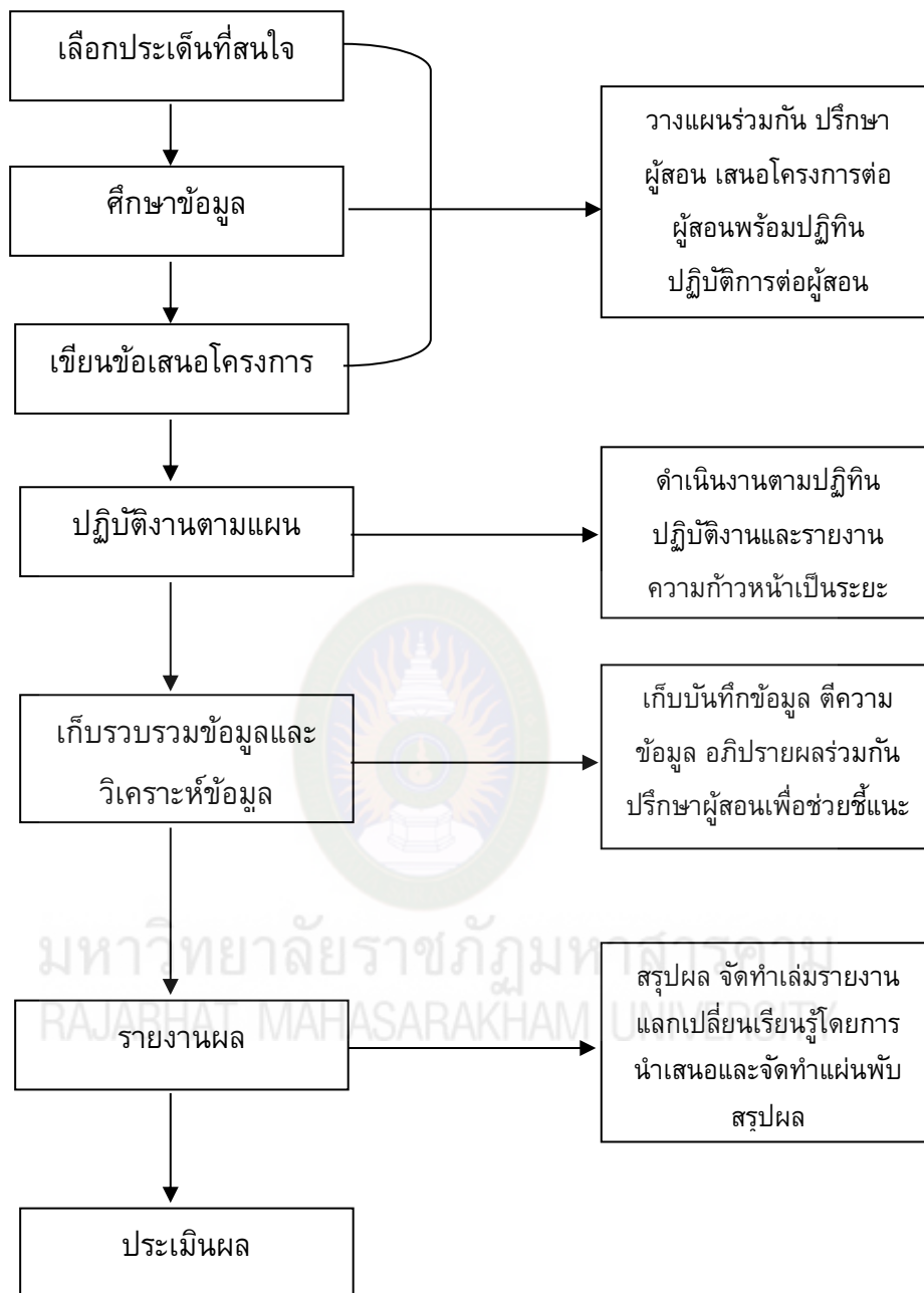
ภาพที่ 4.1 กระบวนการเรียนรู้แบบ Active Learning เพื่อสร้างทักษะความเป็นพลเมืองตามระบอบประชาธิปไตยสำหรับนักศึกษามหาวิทยาลัย