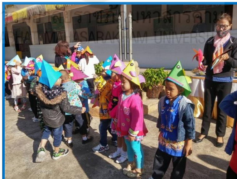
ภาคผนวก ค.4

เด็กปฐมวัยใช้สื่อนิทานและร่วมแสดงบทบาทสมมติประกอบการเล่านิทาน