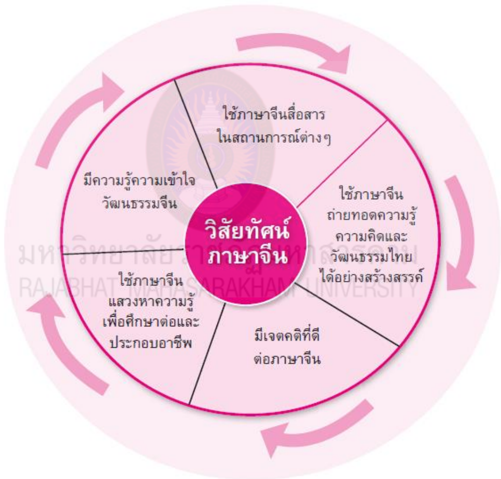
ภาพที่ 1 วิสัยทัศน์ภาษาจีน