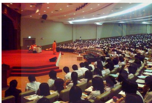
ภาพการฟังปาฐกถา