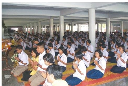
ภาพการแสดงตนเป็นพุทธมามกะ