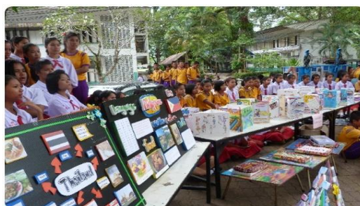
ภาพนักเรียนร่วมมือกันทำกิจกรรมการแสดงนิทรรศการ วิชาการ