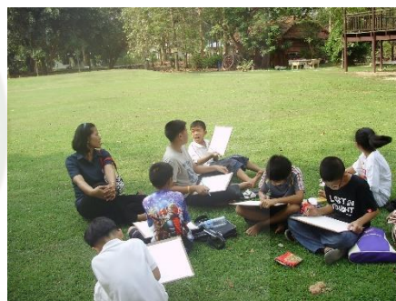
ภาพการเข้าค่ายศิลปะ