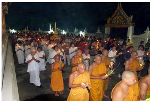
ภาพการเวียนเทียนรอบพระอุโบสถ