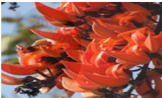
ภาพที่ 2.3 ดอกไม้ประจำมหาวิทยาลัย

“จาน” ออกเสียงเหมือน “จารย์” ซึ่งหมายถึงผู้ที่เคยบวชเรียนจนได้รับการยกย่อง และผ่านพิธีเถรภิเษก (ฮตสรง) เป็นผู้มีคนเคารพนับถือ มีความรู้และคุณธรรม เป็นครูของคน ต้นจานและดอกจานจึงเป็นต้นไม้และดอกไม้ที่ให้ความรำลึกถึงครูอาจารย์ และรำลึกถึงอดีตของมหาวิทยาลัยราชภัฏมหาสารคาม ครั้งที่เป็นวิทยาลัยครูและโรงเรียนฝึกหัดครู ถึงรำลึกถึงการก่อสร้างตัวของคนรุ่นต่างๆ ได้กระทำสืบต่อกันมาอย่างต่อเนื่องอย่างเป็นขั้นเป็นตอนและมั่นคง แม้จะต้องเจอกับปัญหา และอุปสรรค รวมถึงการเปลี่ยนแปลงอันรวดเร็วของสังคมก็ตามที่ เสมือนต้นจานที่ใช้เวลาในการสร้างควมมั่นคงให้กับตนเอง มีความอดทน ทนทาน และปรับตัวให้อยู่กับทุกๆ สภาพของดินทุกๆ สภาพของอากาศที่เปลี่ยนไป สามารถยืนหยัดอยู่ได้อย่างยั่งยืน (สารสนเทศ ปีการศึกษา 2558 มหาวิทยาลัยราชภัฏมหาสารคาม, หน้า 5)