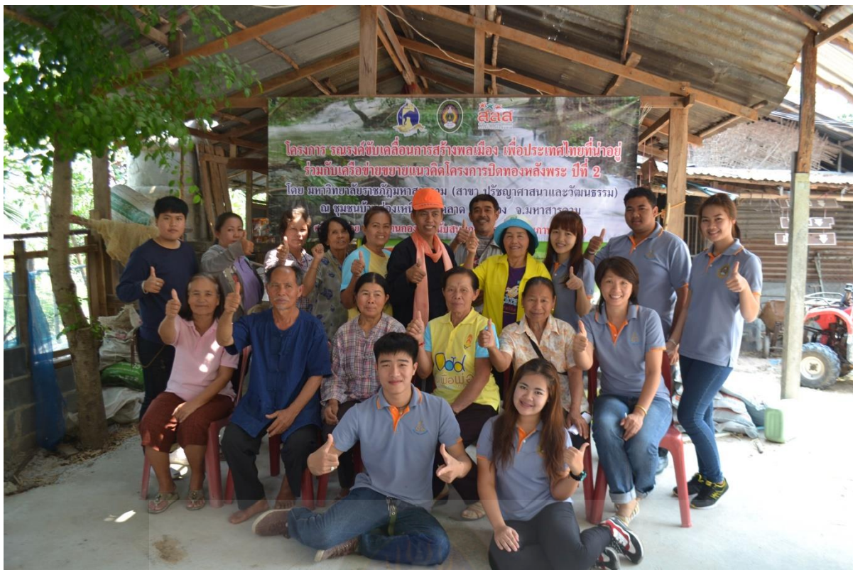
ภาพที่ ก-๙ เวทีสรุปผลและแลกเปลี่ยนเรียนรู้การเลี้ยงไก่ไข่แบบพึ่งพาตนเอง

มหาวิทยาลัยราชภัฏมหาสารคาม RAJABHAT MAHASARAKHAM UNIVERSITY