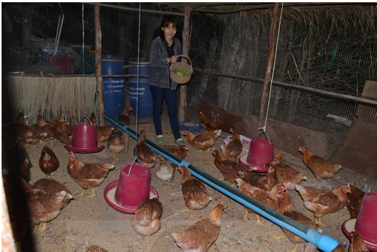
ภาพที่ ก-๗ สภาพเล้าแม่ไก่