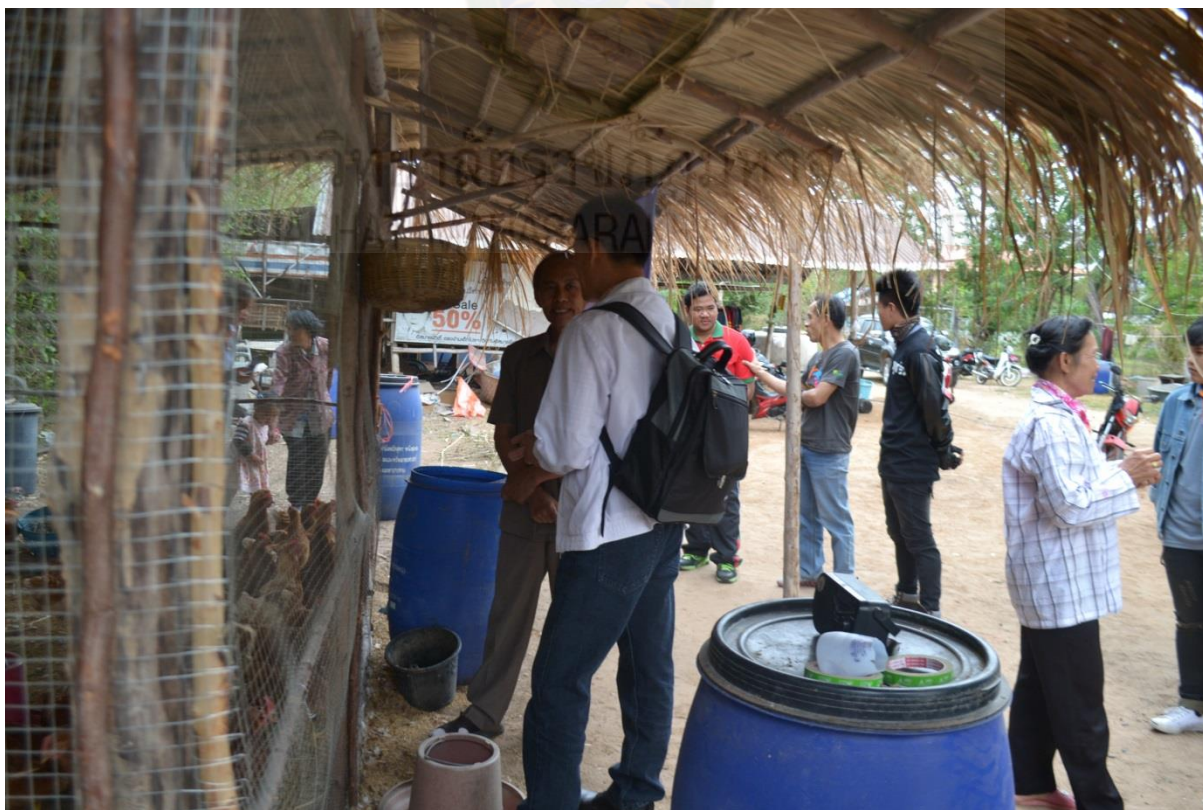
ภาพที่ ก-๘ ลงสำรวจติดตามและประเมินผลการออกไข่