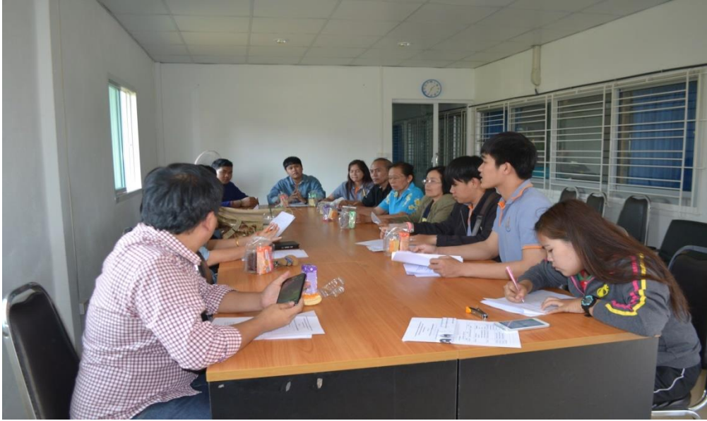
ภาพ ก-๑ ประชุมเสวนาเพื่อสร้างความเข้าใจและส่งเสริมความร่วมมือระหว่างคณะนักศึกษา ผู้นำชุมชน แกนนำในชุมชน และประชาชนในหมู่บ้าน