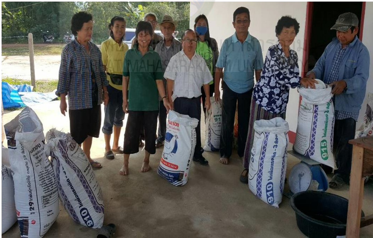
ภาพที่ ก-๔ การจัดตั้งกองทุนอาหารไก่