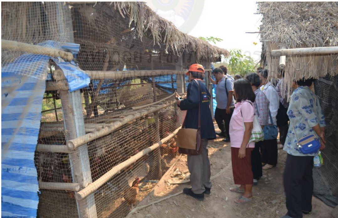
ภาพ ก-๒ การอบรมเชิงปฏิบัติการ (โดยเรียนทฤษฎีที่ศูนย์เกษตรปลอดสารฯ และ เรียนรู้ภาคปฏิบัติที่ศูนย์เศรษฐกิจพอเพียง อำเภอลำปาง) ประจำปีงบประมาณ