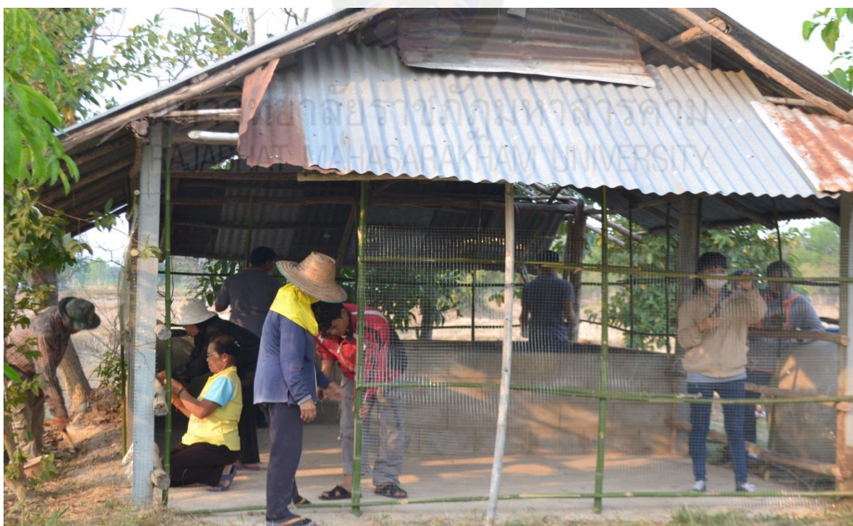
ภาพที่ ก-๖ การปรับปรุงสถานที่เพื่อใช้เป็นโรงเรือนกลุ่มเลี้ยงไก่ไข่