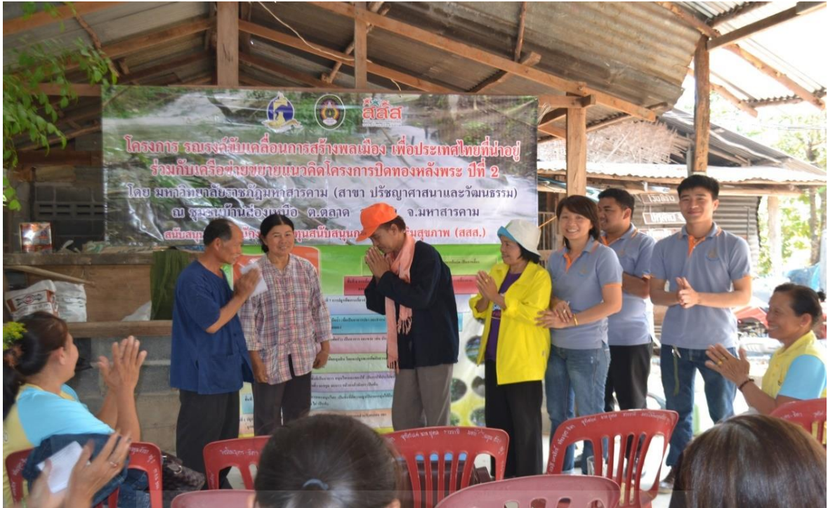
ภาพที่ ก-๓ วิทยากรให้ความรู้เกี่ยวกับวิธีการเลี้ยง การดูแลรักษา และการให้อาหารสำหรับไก่