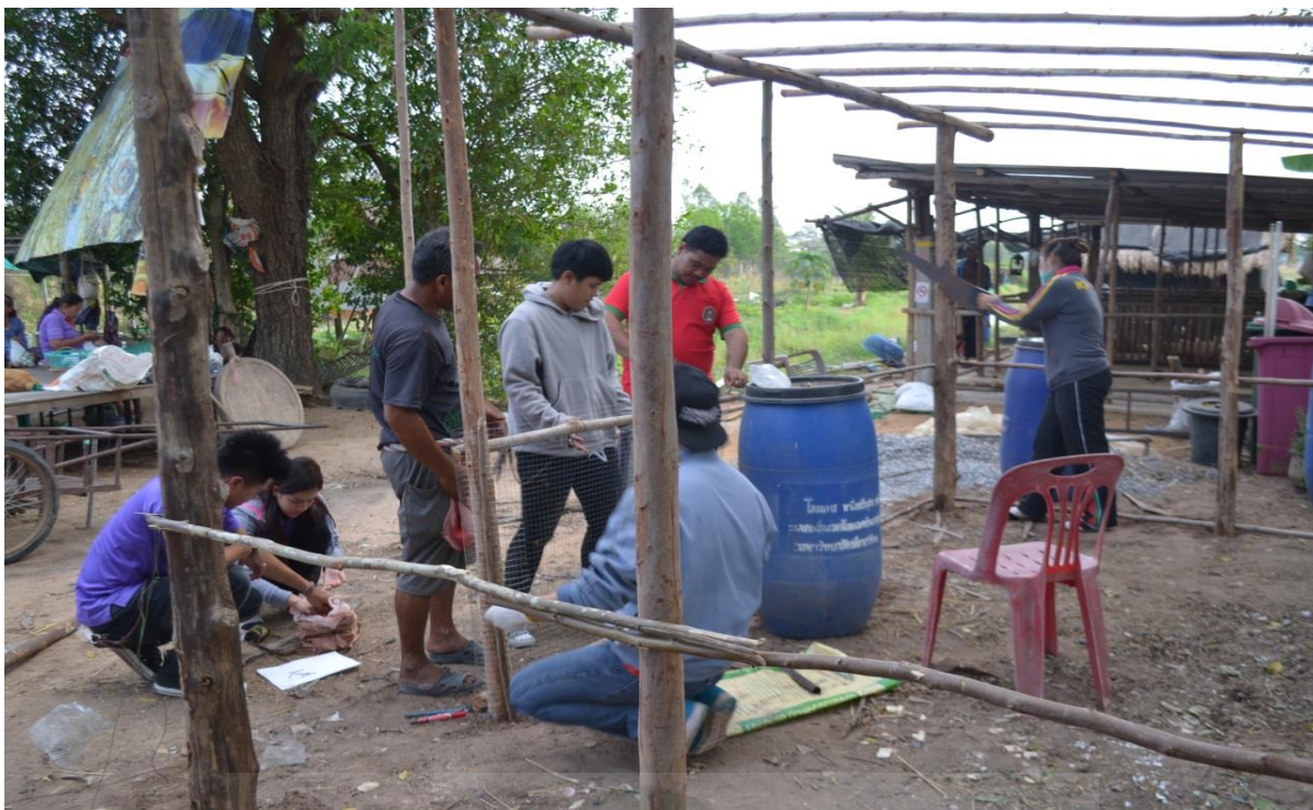
ภาพที่ ก-๕ นักศึกษาและชาวบ้านร่วมกันปรับปรุงสถานที่และจัดสร้างโรงเรือนสำหรับเลี้ยงไก่ไข่