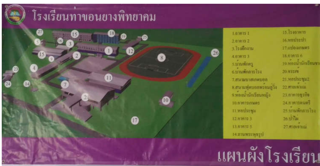
ภาพที่ 2.1 แผนผังโรงเรียนท่าขอนยางพิทยาคม