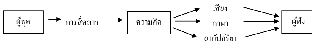
ภาพที่ 2.1 ความหมายของการพูด

ทินวัฒน์ มฤคพิทักษ์ (2515, น. 12) กล่าวว่า การพูด เป็นการสื่อสารความคิดจากผู้พูดไปยังผู้ฟัง โดยมี เสียง ภาษา และอากัปกริยา (Gesture) เป็นสื่อซึ่งแสดงเป็นภาพได้ดังภาพที่ 2.1