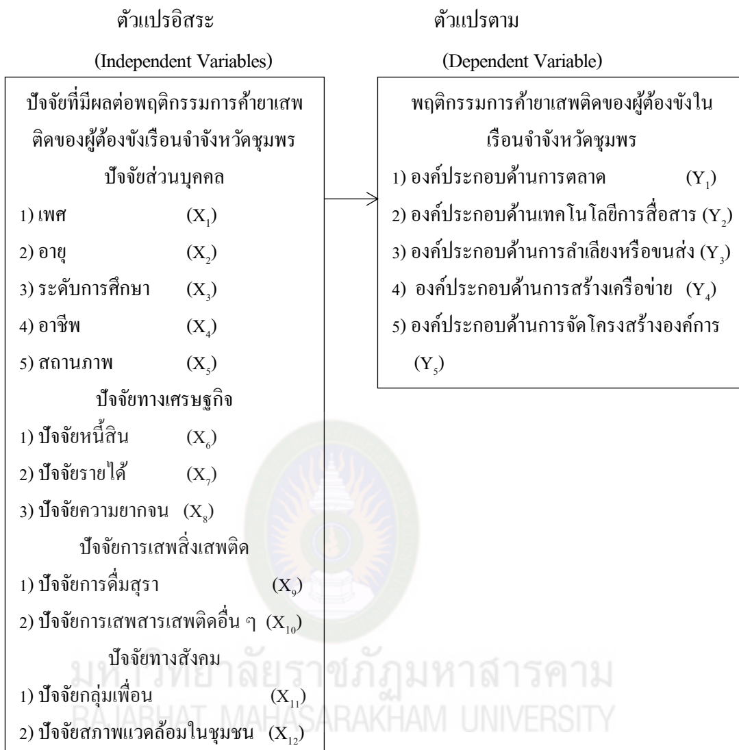
ภาพที่ 2.2 กรอบแนวคิดในการวิจัย