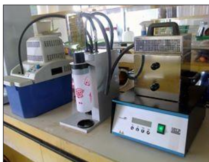
วิเคราะห์หา TKN