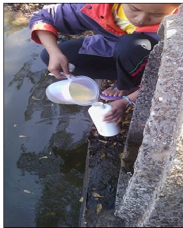
การเก็บตัวอย่างน้ำจากปลายท่อระบายน้ำทิ้ง