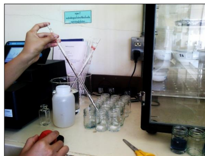
วิเคราะห์หา \text{PO}_4^{3-}