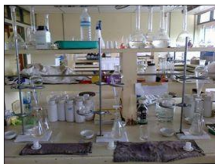
วิเคราะห์หา FOG