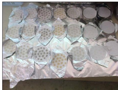
วิเคราะห์หา SS