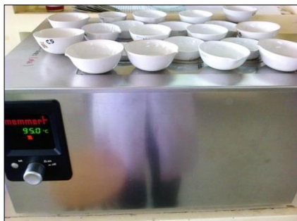
วิเคราะห์หา TDS