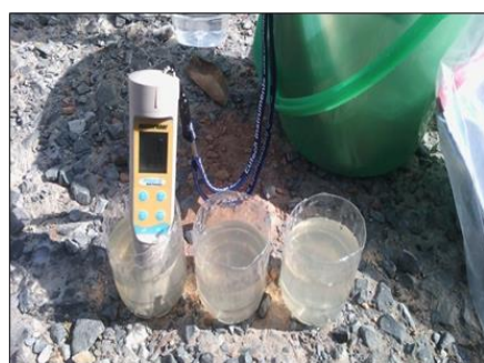
วิเคราะห์หาความเป็นกรดต่าง (ภาคสนาม)