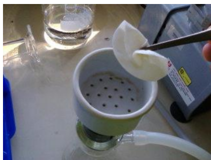
วิเคราะห์หา s^2