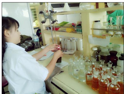
วิเคราะห์หาปริมาณ BOD