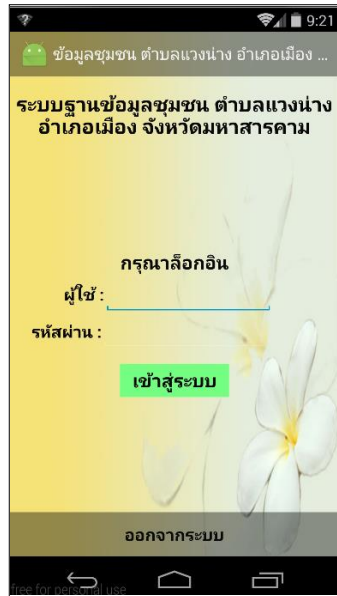
ภาพที่ 16 หน้าล็อกอินเข้าสู่ระบบ ผู้ใช้ระบบ (User)

8. หน้าจอรระบบฐานข้อมูลชุมชน ผ่านแอปพลิเคชันแอนดรอยด์ ตำบลเวียงนาง อำเภอเมือง จังหวัดมหาสารคาม แสดงส่วนของการล็อกอิน ผู้ใช้ระบบ (User) ในส่วนของแอปพลิเคชัน