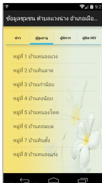
ภาพที่ 17 หน้าแถบเมนู ผู้ใช้ระบบ (User)

9. หน้าจอรระบบฐานข้อมูลชุมชน ผ่านแอปพลิเคชันแอนดรอยด์ ตำบลเวียงนาง อำเภอเมือง จังหวัดมหาสารคาม แสดงส่วนของแถบเมนู ผู้ใช้ระบบ (User) ในส่วนของแอปพลิเคชัน