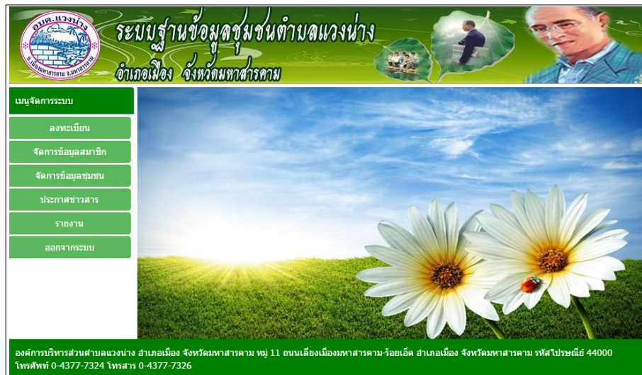
ภาพที่ 10 หน้าแสดงเมนูรวมของระบบ (Admin)

2. หน้าจอหลักของเว็บไซต์ระบบฐานข้อมูลชุมชน ผ่านแอปพลิเคชันแอนดรอยด์ ตำบลเวียงน่าง อำเภอเมือง จังหวัดมหาสารคาม โดยแสดงข้อมูลเมนูการใช้งานต่างๆที่อยู่บนหน้าเว็บไซต์ เช่น เมนูลงทะเบียน เมนูจัดการข้อมูลสมาชิก เมนูจัดการข้อมูลชุมชน เมนูประกาศข่าวสาร เมนูรายงาน และเมนูออกจากระบบ เป็นต้น