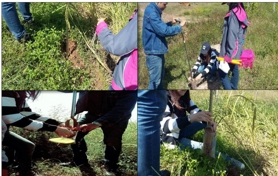
ภาพที่ ค-1 การเก็บตัวอย่างดิน