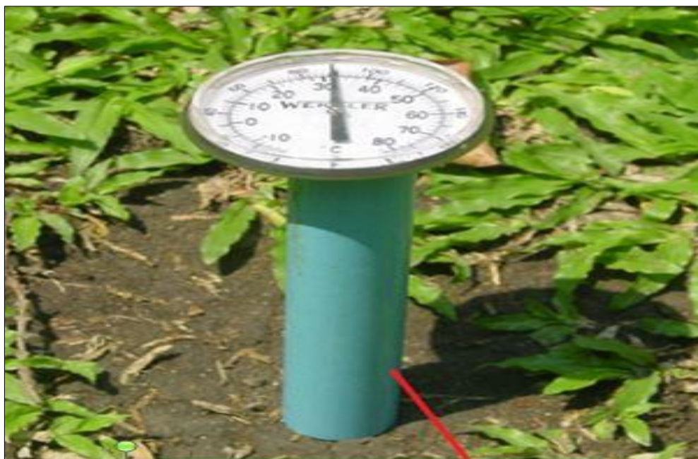
ภาพที่ ค-2 แสดงวิธีการวัดอุณหภูมิในดิน