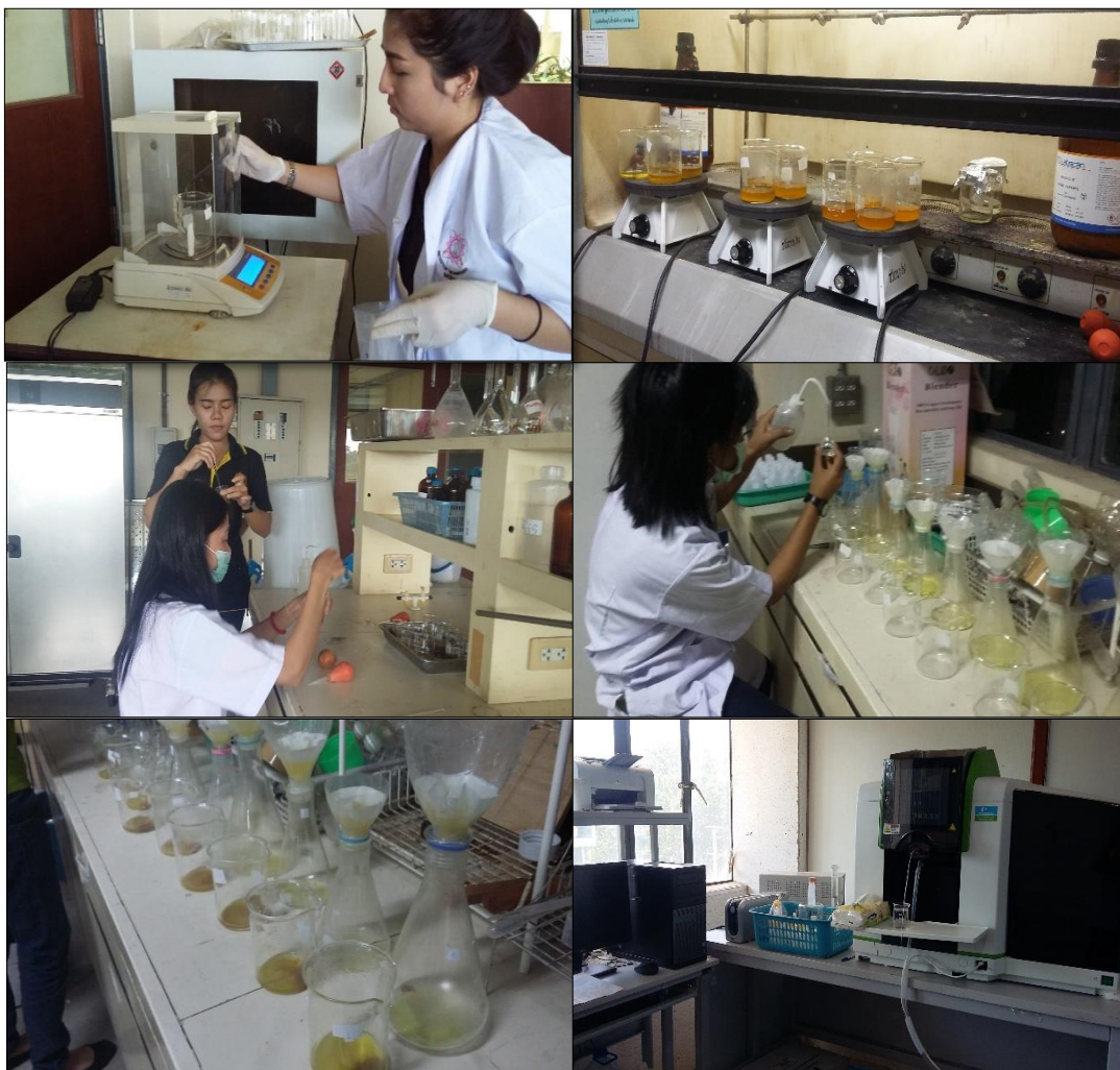
ภาพที่ ค-7 แสดงวิธีการย่อยตัวอย่างดินเพื่อนำไปหาโลหะหนัก