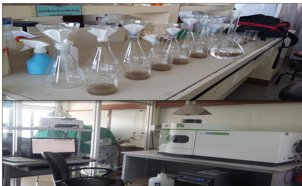
ภาพที่ ค-6 แสดงวิธีการย่อยโปแทสเซียมที่เป็นประโยชน์