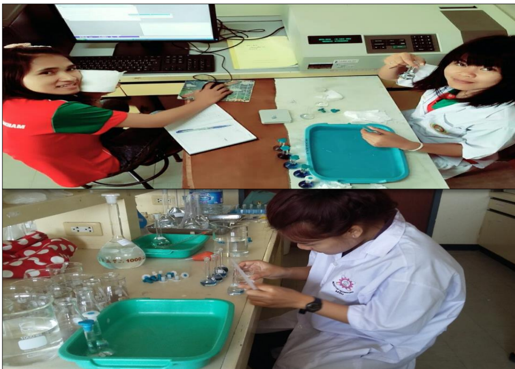
ภาพที่ ค-5 แสดงวิธีการย่อยฟอสฟอรัสที่เป็นประโยชน์