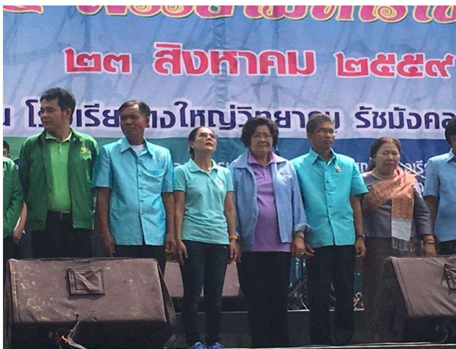
ภาพที่ ข-1 พิธีเปิดงานมหกรรมเฉลิมพระเกียรติ 72 พรรษามหาราชาครั้งที่ 13 ในวันที่ 23 สิงหาคม พ.ศ. 2559