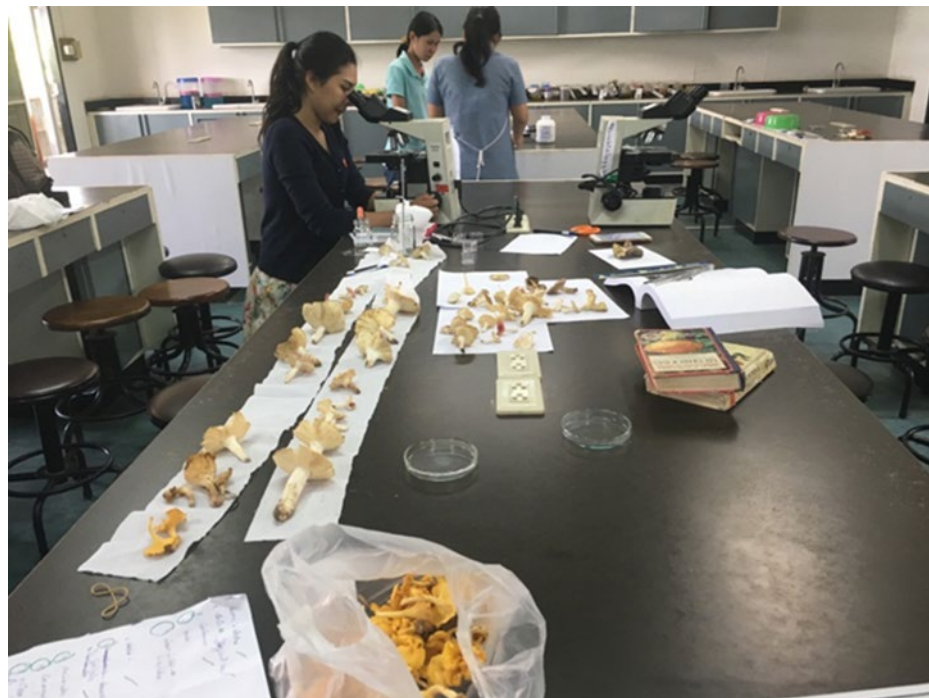
ภาพที่ ข-3 การเรียนการสอนวิชาเห็ดวิทยานักศึกษาปริญญาวิทยาศาสตรบัณฑิต สาขาวิชาชีววิทยา คณะวิทยาศาสตร์และเทคโนโลยี