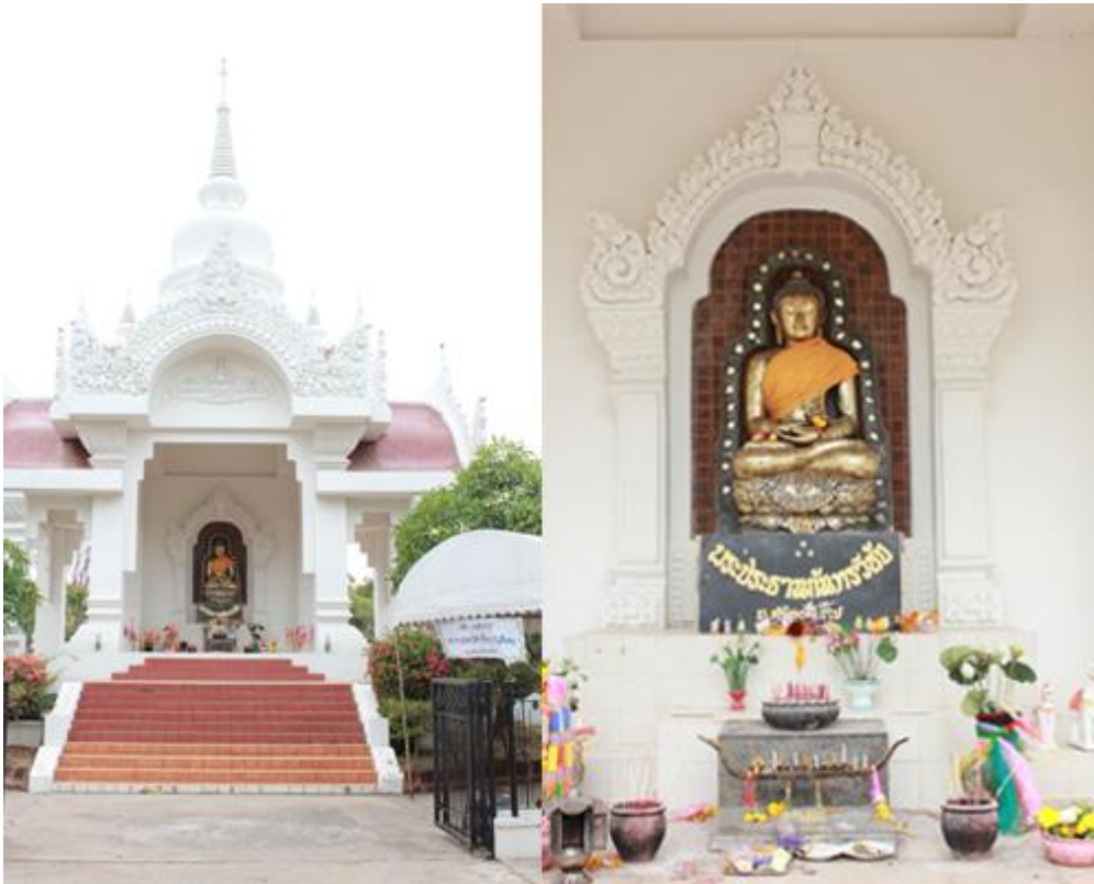
ภาพที่ 4.8 พระประธานพระพุทธรูปกัณฑ์ทวิชัย (บริเวณสนามที่ว่าการอำเภอเมืองมหาสารคาม หลังเก่า)

นอกจากนี้ยังมีหลักฐานที่บ่งบอกถึงความเป็นพื้นที่ซึ่งได้รับอิทธิพลของวัฒนธรรมทวารวดี เช่น ใบเสมาหินทราย ซึ่งจากการสำรวจกลุ่มเสมาหินในภาคอีสานในเขตเมืองฟ้าแดดสงยาง และเมืองโบราณ กัณฑ์ทวิชัยมีที่มาอยู่ 2 กลุ่ม (ศรีศักร วัลลิโภดม. 2518 ) กลุ่มแรกอยู่ในบริเวณที่เรียกว่าโนนพระนอนจะอยู่นอก คูเมืองบริเวณทางด้านทิศใต้ทางฝั่งตะวันตกของถนนสายมหาสารคาม-กาฬสินธุ์ โดยพบใบเสมาปักอยู่ 4 หลัก ซึ่งมีลักษณะเป็นแผ่นหินเปล่าไม่มีรูปสลัก ปักอยู่รอบ ๆ บริเวณเนินดินอย่างไม่มีกำหนดทิศทาง ชาวบ้านมีความเชื่อเกี่ยวกับเนินดินนี้ว่ามีความศักดิ์สิทธิ์และได้สร้างศาลเจ้าไว้เคารพบูชา บริเวณหน้าศาลมีฐานศิลาหักอยู่ส่วนหนึ่ง มีลวดลายบัวคว่ำบัวหงาย ลักษณะของบัวเป็นแบบทวารวดีตอนปลายซึ่งกำลังเข้าสู่สมัยลพบุรี