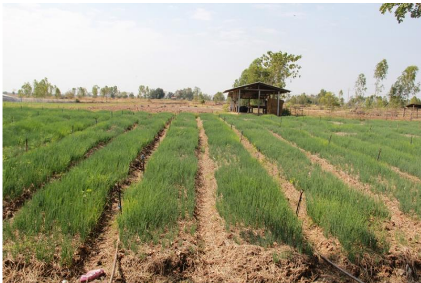
ภาพที่ 4.7 พื้นที่ในการทำเกษตรในเมืองกันทรวิชัยในปัจจุบัน