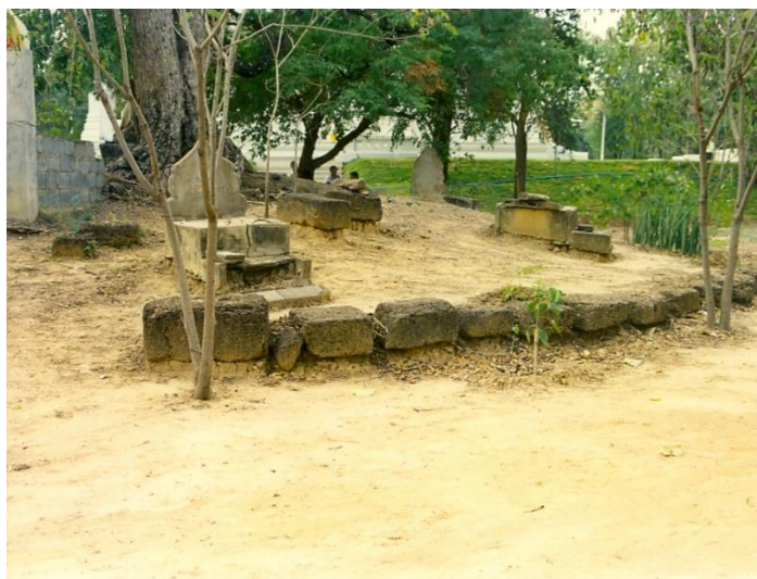
ภาพที่ 4.5 ฝั้งคูน้ำที่ล้อมรอบเมืองโบราณกันทรวิชัย (กู๋คูขาด)