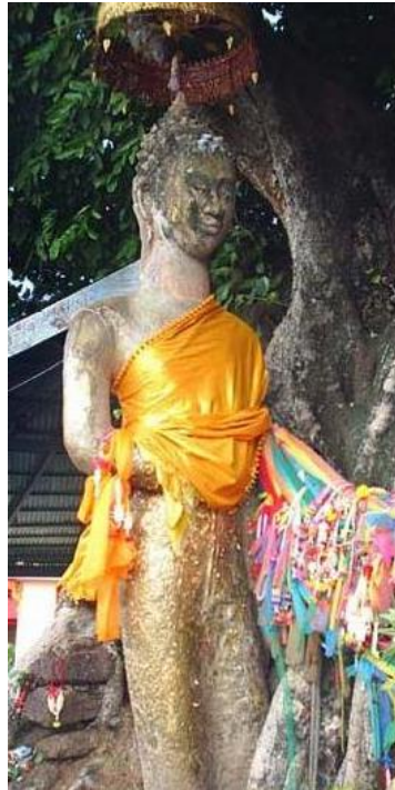
ภาพที่ 4.11 พระพุทธมงคล บริเวณวัดบ้านสระ อำเภอกันทรวิชัย จังหวัดมหาสารคาม

กลุ่มที่สองจะอยู่ภายในบริเวณวัดพระยืน (วัดพุทธมงคล) ซึ่งอยู่ภายในบริเวณเมืองทางด้านใต้ทางฝั่งตะวันออกของถนนสายมหาสารคาม-กาฬสินธุ์ ณ บริเวณนี้มีเนินดินตรงกลางเนินดินมีต้นโพธิ์ใหญ่ที่ใต้ต้นโพธิ์ใหญ่มีพระพุทธรูปยืนศิลปะแบบทวารวดี แต่เป็นฝีมือของช่างท้องถิ่นมีรอยของการซ่อมแซมหลายแห่ง บริเวณที่ประดิษฐานพระพุทธรูปองค์นี้แต่เดิมคงเป็นฐานอาคารเพราะพบเศษอิฐอยู่ใกล้ ๆ บริเวณต้นไม้รอบ ๆ เนินมีเสมาหินแบบแผ่นหินปักอยู่รอบ ๆ หลายหลัก