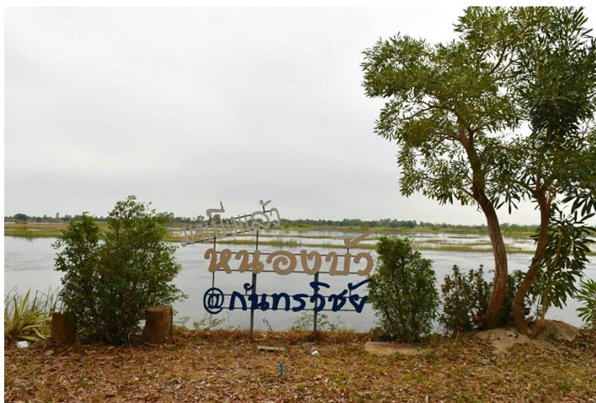
ภาพที่ 4.6 ริมฝั่งน้ำหนองบัวในปัจจุบัน

ยุคของการพัฒนาเมือง ราว พ.ศ. 2456-2500 ภายหลังจากมีการยุบเมืองกันทรวิชัยลง เป็นอำเภอกันทรวิชัย และโอนอำเภอกันทรวิชัยมาขึ้นกับเมืองมหาสารคามในปี พ.ศ. 2456 เดิมที่ว่าการ อำเภอกันทรวิชัยได้ตั้งอยู่บริเวณริมฝั่งหนองบัวทางด้านทิศใต้ ปัจจุบันได้กลายเป็นสถานที่ตั้งของโรงเรียนบ้าน คันธาร์ เนื่องจากสถานที่ตั้งที่ว่าการอำเภอกันทรวิชัยเดิมมีความคับแคบ ไม่สามารถขยายเมืองได้อีก ประกอบกับขณะนั้นชุมชนบ้านโคกพระได้ตั้งชุมชนเป็นปึกแผ่นแล้วและมีที่ดินว่างเปล่าเพียงพอที่สามารถรองรับการขยายเมืองได้