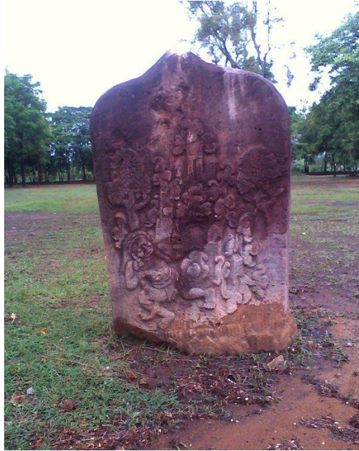
ภาพที่ 4.9 เสาหินที่พบในเขตจังหวัดกาฬสินธุ์ (วัดโพธิ์ชัยเสมาราม)