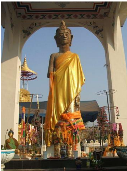
ภาพที่ 4.3 พระพุทธรูปสมัยทวารวดีที่พบในเมืองกันทรวิชัย