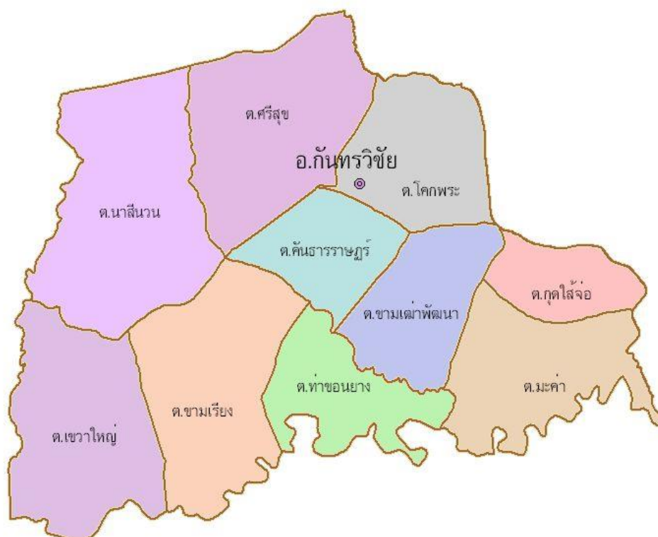
ภาพที่ 4.2 แผนที่อำเภอกันทรวิชัย