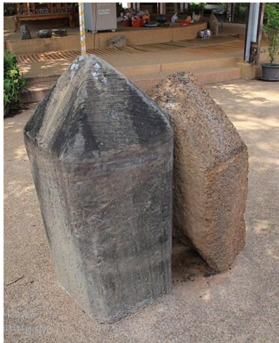
ภาพที่ 4.10 เสาหินที่พบในเขตกันทรวิชัยวิชัย จังหวัดมหาสารคาม (วัดบ้านสระ)