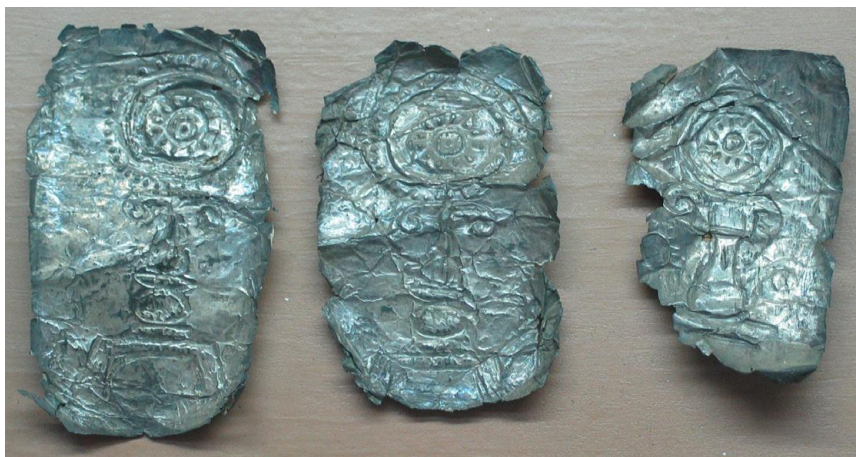
ภาพที่ 4.12 แผ่นเงินคูนนูนจากเมืองกันทรวิชัยจัดแสดงในพิพิธภัณฑ์สถานแห่งชาติ ขอนแก่น

แผ่นเงินคูนนูนจากเมืองกันทรวิชัย อำเภอกันทรวิชัย จังหวัดมหาสารคาม ชุดค้นพบจากโบราณสถานที่ยกกันว่า “อุมญาคุ” เมืองกันทรวิชัย อำเภอกันทรวิชัย จังหวัดมหาสารคาม เมื่อ พ.ศ. 2515 มีจำนวนทั้งสิ้น 66 แผ่น บรรจุอยู่ในภาชนะดินเผาซึ่งฝังอยู่ภายใต้ฐานพระประธาน แผ่นเงินเหล่านี้คูนนูนเป็นภาพต่างๆ เช่น พระพุทธรูป ธรรมจักร สถูป หม้อน้ำซ้อนชั้น เทวดา เป็นต้น เกี่ยวกับลัทธิในยุคนั้น หม่อมเจ้าสุภัทรดิศ ดิศกุล ซึ่งเป็นผู้ศึกษาแผ่นเงินเหล่านี้เป็นพระองค์แรกได้กล่าวว่า น่าจะสร้างขึ้นเนื่องในพุทธศาสนาเถรวาท เพราะไม่พบรูปพระโพธิสัตว์เลย