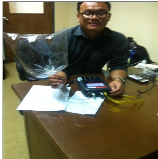
ภาพที่ ก-16 เครื่องวัดก๊าซ Gas Analyzer