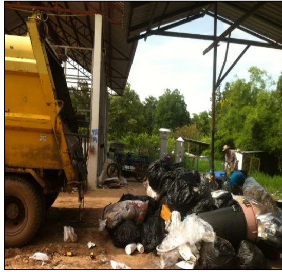
ภาพที่ ก-2 การเก็บขนมูลฝอยในแต่ละวัน