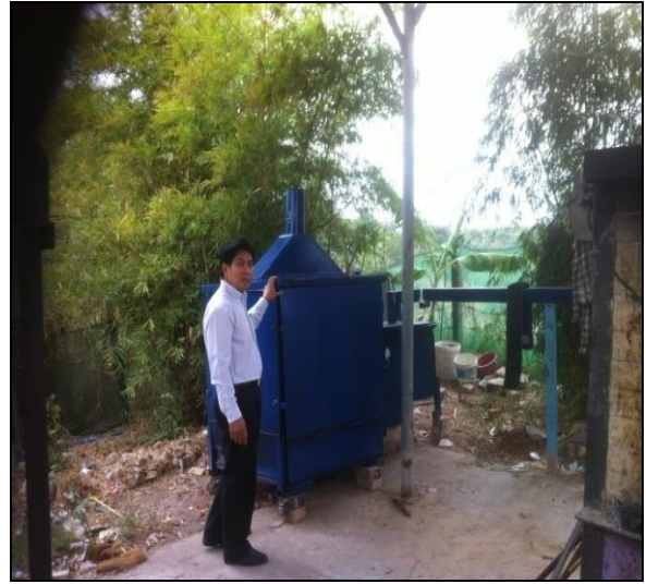
ภาพที่ ก-10 การติดตั้งระบบที่โรงเตาเผามูลฝอย