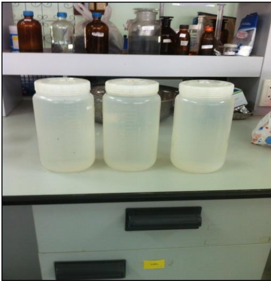
ภาพที่ ก-17 เก็บน้ำมาวิเคราะห์ที่ห้องปฏิบัติการ