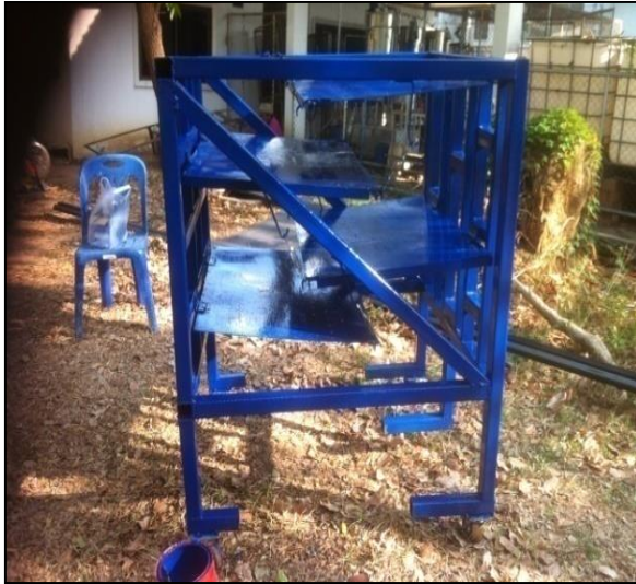
ภาพที่ ก-5 โครงสร้างระบบน้ำตกแบบชั้นบันได