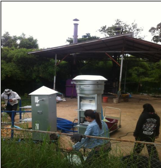
ภาพที่ ก-11 การติดตั้งเครื่องวัดปริมาณฝุ่นในอากาศ