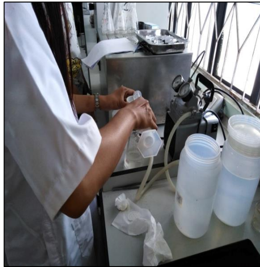
ภาพที่ ก-18 การหาค่าของแข็งแขวนลอย