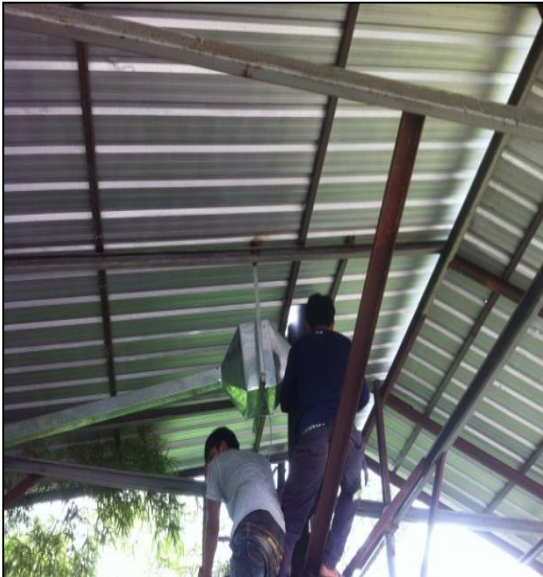
ภาพที่ ก-3 การติดตั้งระบบปล่องดูดอากาศเสีย