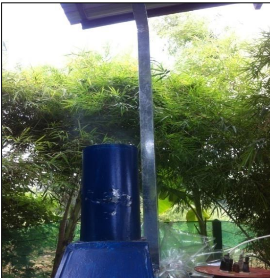
ภาพที่ ก-15 อากาศที่ออกจากระบบที่ปลายปล่อง