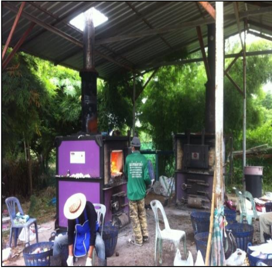
ภาพที่ ก-1 การปฏิบัติงานที่เตาเผามูลฝอยชุมชน