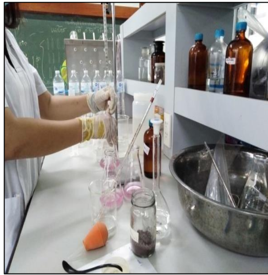
ภาพที่ ก-20 การหาค่าความกระด้างของน้ำ