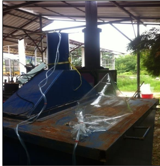
ภาพที่ ก-14 การเก็บอากาศออกจากระบบ