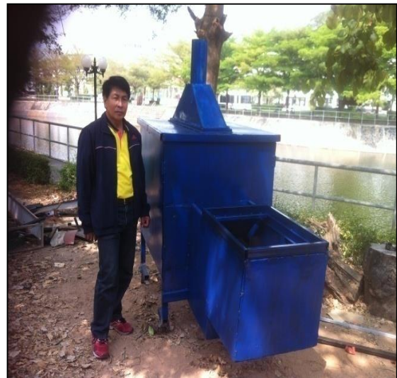
ภาพที่ ก-8 การสร้างระบบน้ำตกแบบชั้นบันได