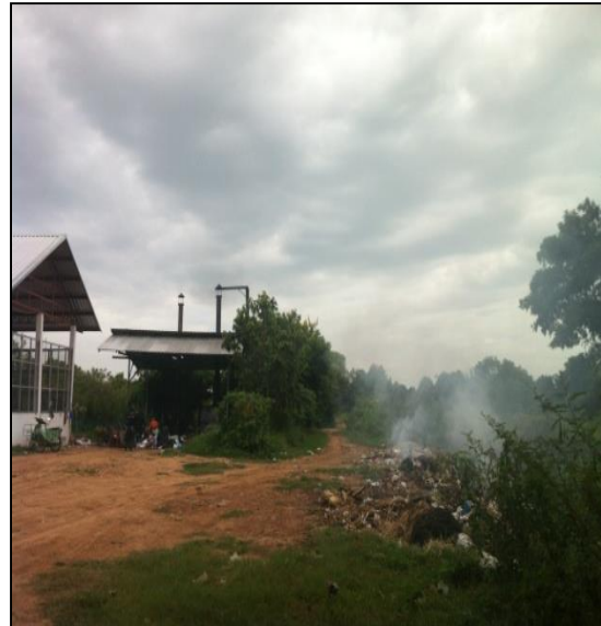
ภาพที่ ก-4 สภาพทั่วไปในการปฏิบัติงาน