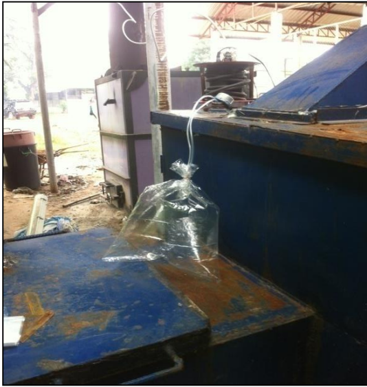
ภาพที่ ก-13 การเก็บอากาศเสียก่อนเข้าระบบ