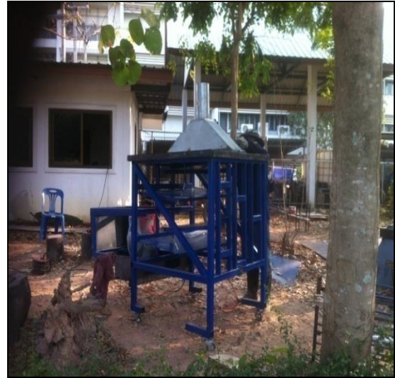
ภาพที่ ก-6 การก่อสร้างระบบน้ำตกแบบชั้นบันได