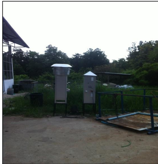
ภาพที่ ก-12 เครื่องวัด TSP และ PM 10