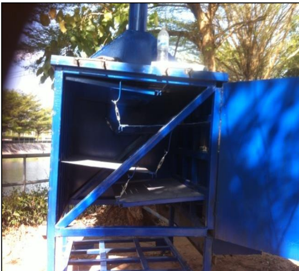
ภาพที่ ก-7 ภายในระบบน้ำตกแบบชั้นบันได