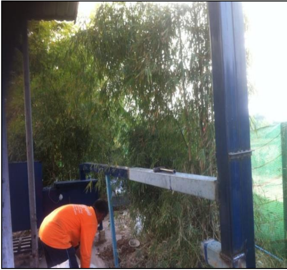
ภาพที่ ก-9 การติดตั้งปล่องดูดอากาศเสียเข้าระบบ