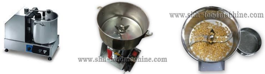
ภาพที่ 1.1 เครื่องบดละเอียดโดยทั่วไป

โดยใบมีดสามารถถอดออกแบบ ตามความเหมาะสมกับการใช้งานได้ และใช้สแตนเลสในการประกอบเป็น ตัวเครื่องเพื่อให้สอดคล้องกับระบบมาตรฐาน GMP