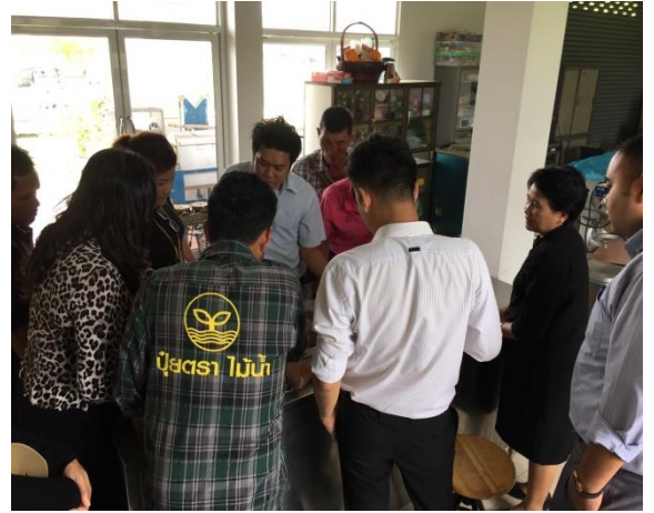
ภาพที่ ก-7 การจัดอบรมให้กับสมาชิกทางกลุ่มวิสาหกิจ