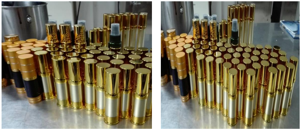
ภาพที่ ก-5 ผลิตภัณฑ์ต้นแบบของซีรัมปิดผนึกขาวจากข้าวไรซ์เบอร์รี่