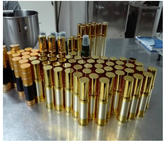
ภาพที่ ก-3 การบรรจุผลิตภัณฑ์