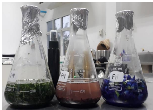
ภาพที่ ก-1 วัตถุดิบที่ใช้ในการพัฒนาผลิตภัณฑ์