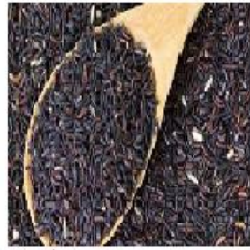
ข้าวไรซ์เบอร์รี่