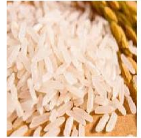
ข้าวหอมมะลิ