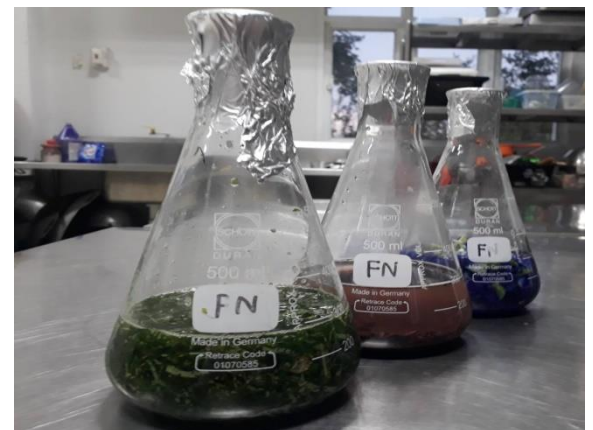
ภาพที่ ก-2 การสกัดส่วนผสม