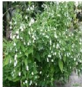
ทองพันชั่ง