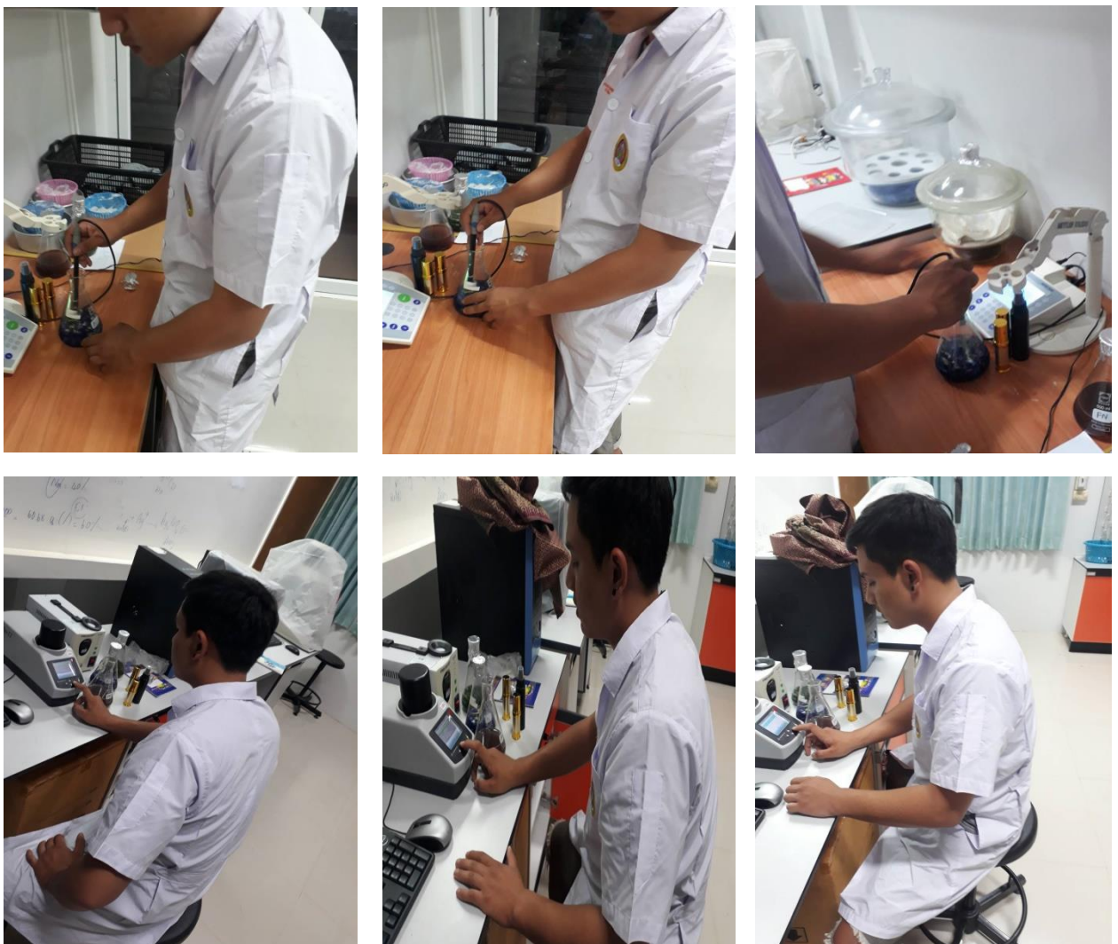
ภาพที่ ก-6 การตรวจวิเคราะห์คุณภาพผลิตภัณฑ์