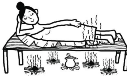
ภาพที่ ๔.๑ แสดงการนอนอย่างไฟ (อยู่ไฟ) หลังจากสตรีคลอดบุตร ที่มา : กฤษฎา ศรีธรรมา และคณะ. ๒๕๖๑