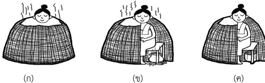
ภาพที่ ๔.๒ (ก) แสดงการอบสมุนไพรของสตรีหลังคลอดบุตรแบบโบราณด้วยการใช้สุมไม้เพื่อใช้ ไอน้ำร้อนช่วยขับเหงื่อและน้ำคาวปลา (ของเสีย/พิษ) ออกจากร่างกาย (ข) แสดงอุปกรณ์ประกอบวิธีการอบสมุนไพรด้วยไอน้ำด้วยการใช้สุมไม้แบบโบราณ (หม้อดิน) (ค) แสดงอุปกรณ์ประกอบวิธีการอบสมุนไพรด้วยไอน้ำด้วยการใช้สุมไม้แบบ ปัจจุบัน (หม้อหุงข้าว)