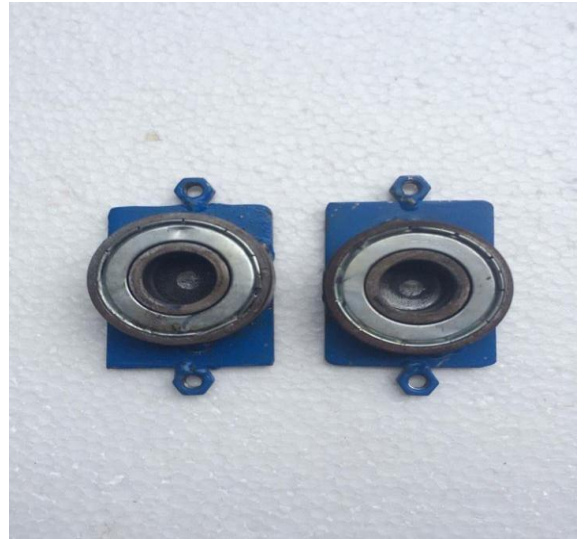
รูปที่ 4 แสดงตุ้กดาลูกปืนต่อแกนเพลลาหมุน