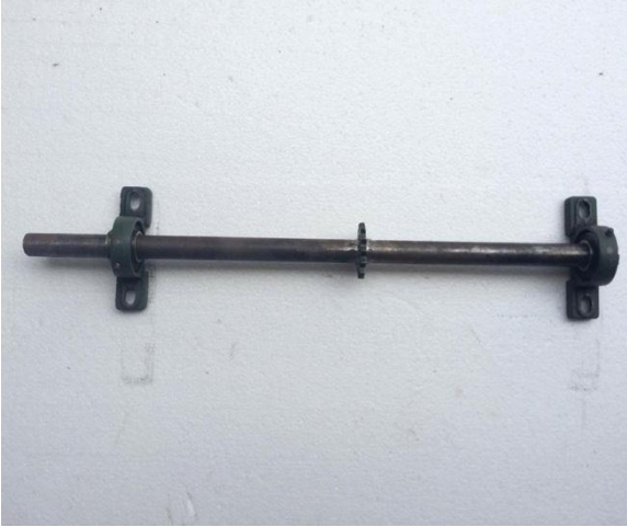
รูปที่ 5 แสดงลักษณะเพลาประวงล้อ