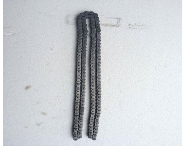
รูปที่ 6 แสดงลักษณะโซ่ยึดติดเฟืองหมุนวงล้อ