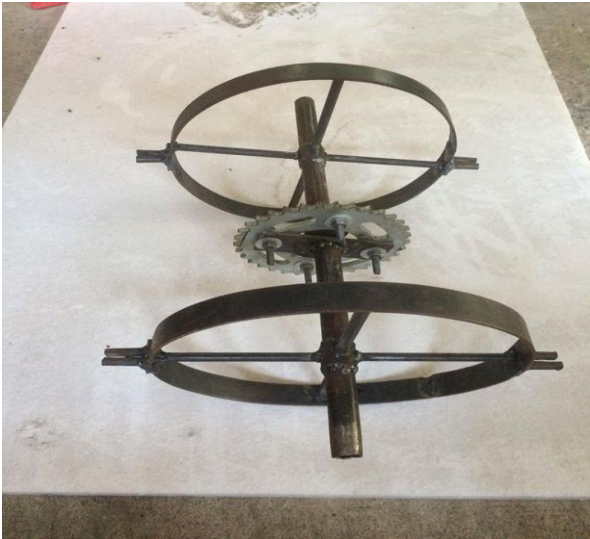
รูปที่ 3 แสดงวงล้อปิดปั๊กดำต้นกล้า