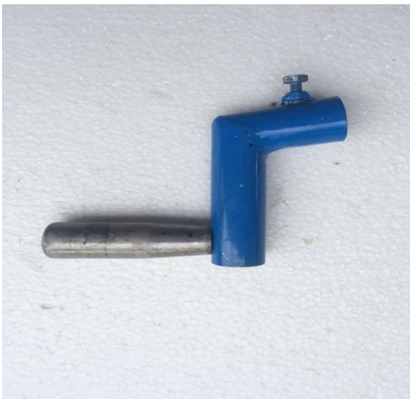
รูปที่ 7 แสดงลักษณะมือหมุนโยกวงล้อปิดดำ