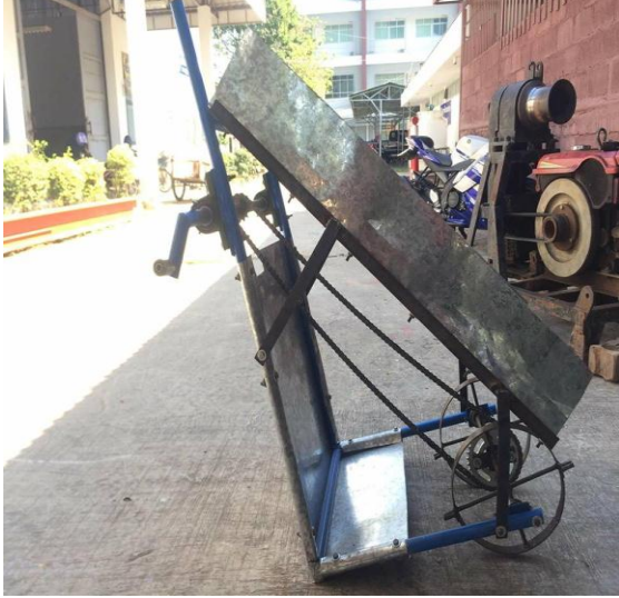
รูปที่ 1 แสดงลักษณะอุปกรณ์ปั๊กดำต้นกล้า