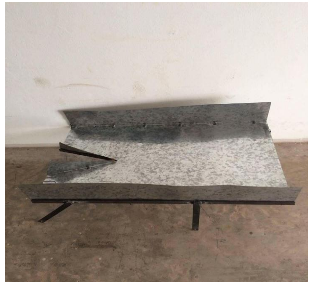
รูปที่ 8 แสดงลักษณะภาดกระบะรองต้นกล้า