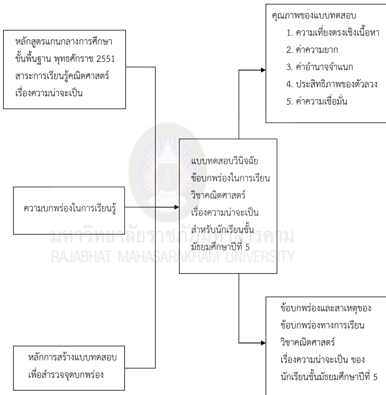
ภาพที่ 1 กรอบแนวคิดในการวิจัย

จากการศึกษาแนวคิด เอกสารและงานวิจัยที่เกี่ยวข้องกับการสร้างแบบทดสอบวินิจฉัย ได้นำมาจัดทำเป็นกรอบแนวคิดของการวิจัย ดังนี้