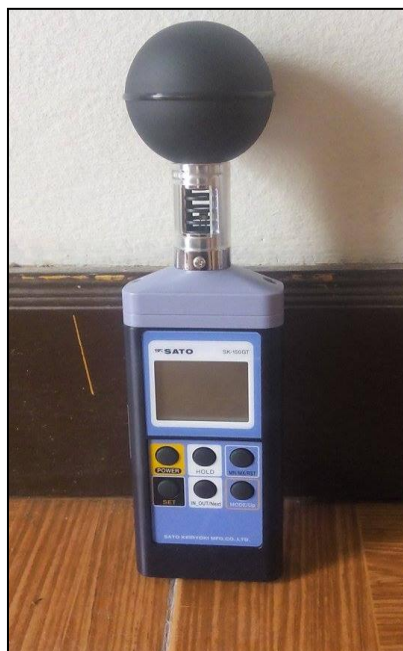
ภาพที่ ค.2 เครื่องตรวจวัดระดับความร้อน

อุปกรณ์ที่ใช้ในการตรวจวัดระดับความร้อน ได้แก่ เครื่องมือวัดดัชนีความร้อน WBGT Heat Stress monitor รุ่น SK-150 GT ยี่ห้อ SK-SATO