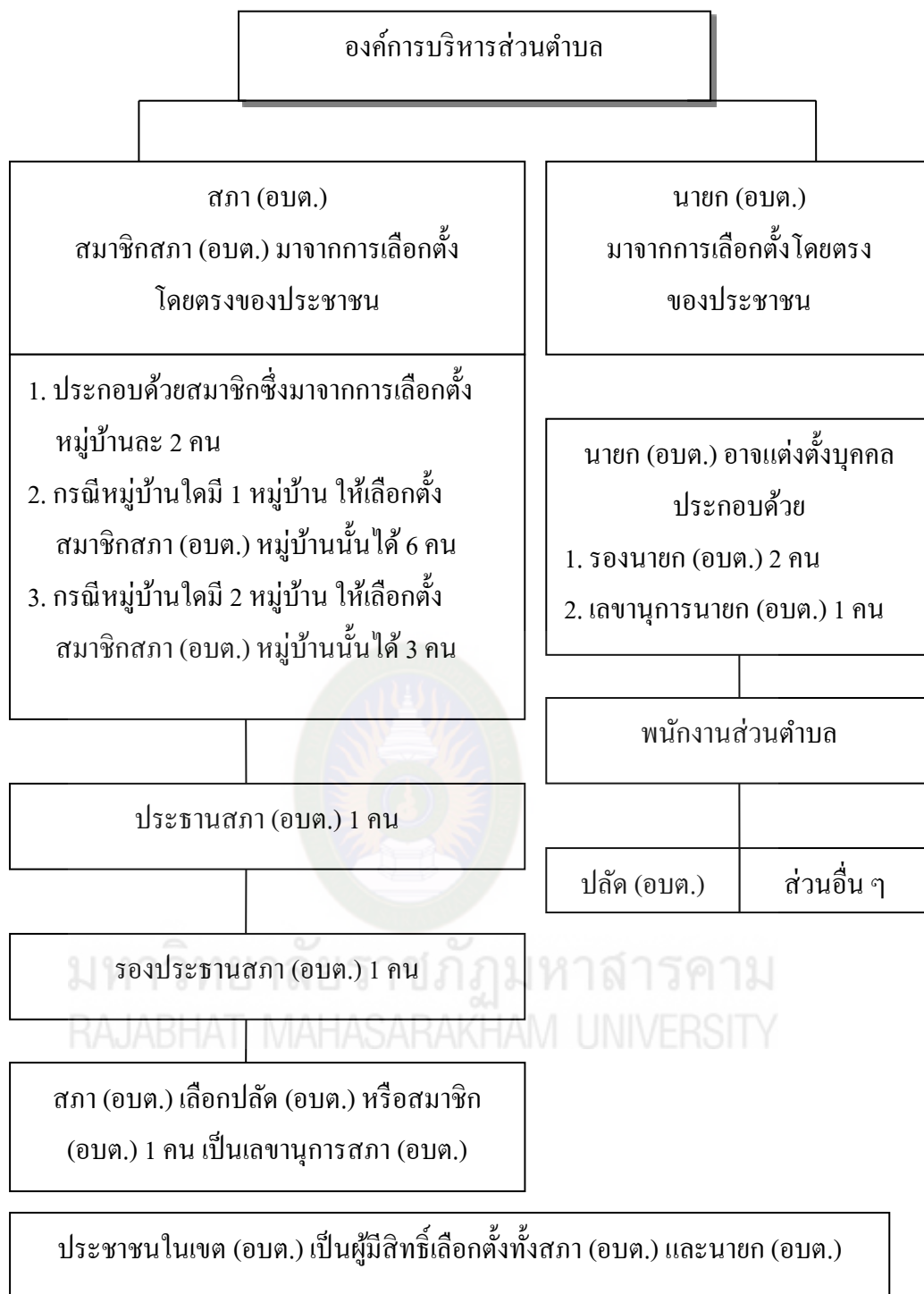
ภาพที่ 2.1 ตัวอย่างการวางภาพประกอบการทำทนิพนธ์. ปรับปรุงจาก โครงสร้างองค์การบริหารส่วนตำบล (น. 157), โดย โกวิท พวงงาม, 2550, กรุงเทพฯ ฯ : วิญญูชน.