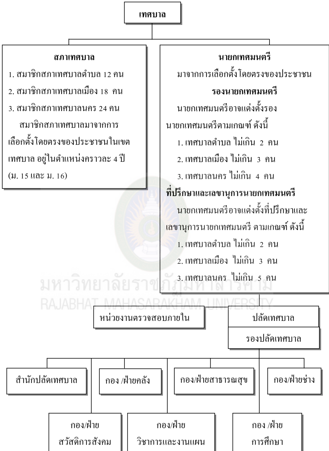
แผนภาพที่ 1 โครงสร้างและการแบ่งส่วนราชการบริหารของเทศบาล