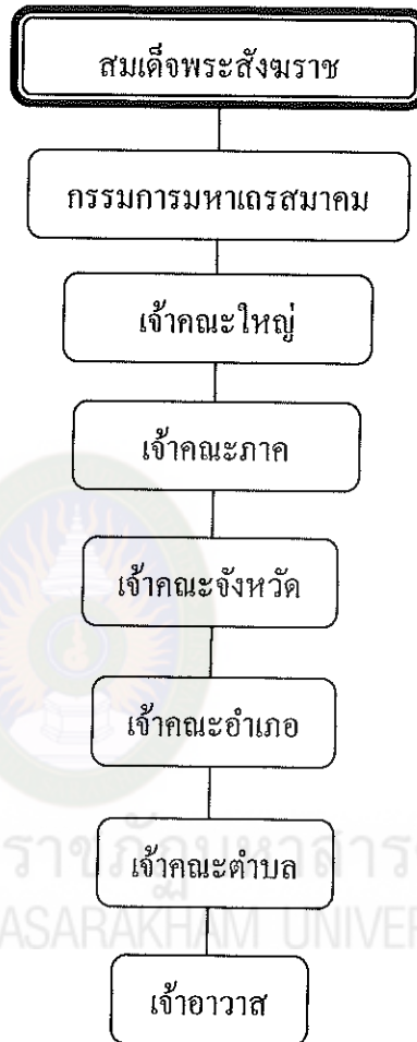
แผนภูมิที่ 1 โครงสร้างการปกครองคณะสงฆ์ไทยในปัจจุบัน

ชั้นการปกครองคณะสงฆ์เป็นการปกครองคณะสงฆ์ส่วนกลาง และส่วนภูมิภาค พระราชบัญญัติคณะสงฆ์ (ฉบับที่ 2) พ.ศ. 2535 (2535 : 9) โดยในพระราชบัญญัติฉบับนี้ได้แบ่งสายบังคับบัญชาโดยมีลำดับชั้นของการปกครอง ดังปรากฏในแผนภูมิที่ 1