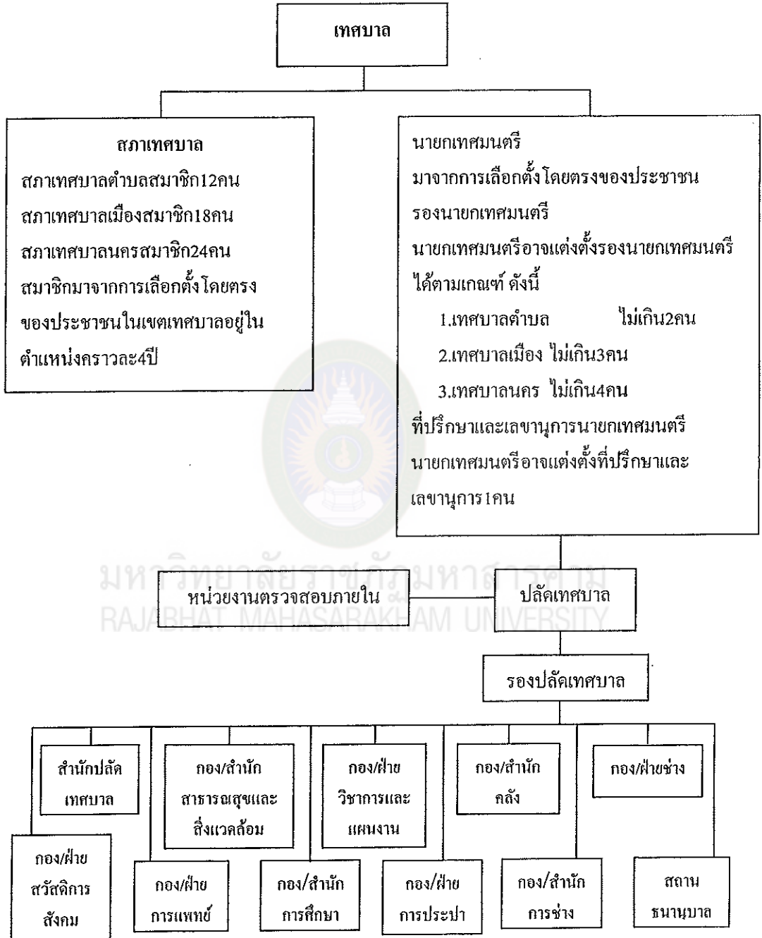
แผนภูมิที่ 3 โครงสร้างของเทศบาล ตามพระราชบัญญัติเทศบาล พ.ศ. 2496 แก้ไขเพิ่มเติม (ฉบับที่ 13) พ.ศ. 2552

5) การจัดตั้ง การปรับปรุง การรวมหรือยุบส่วนราชการ ให้เทศบาลพิจารณา เสนอความเห็นและพิจารณาอัตรากำลัง การจัดสรรงบประมาณให้สอดคล้องกันแล้วเสนอต่อ คณะกรรมการพนักงานเทศบาล พิจารณาให้ความเห็นชอบ