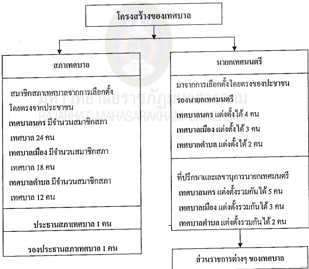
แผนภูมิที่ 2 โครงสร้างเทศบาลในรูปแบบนายกเทศมนตรี