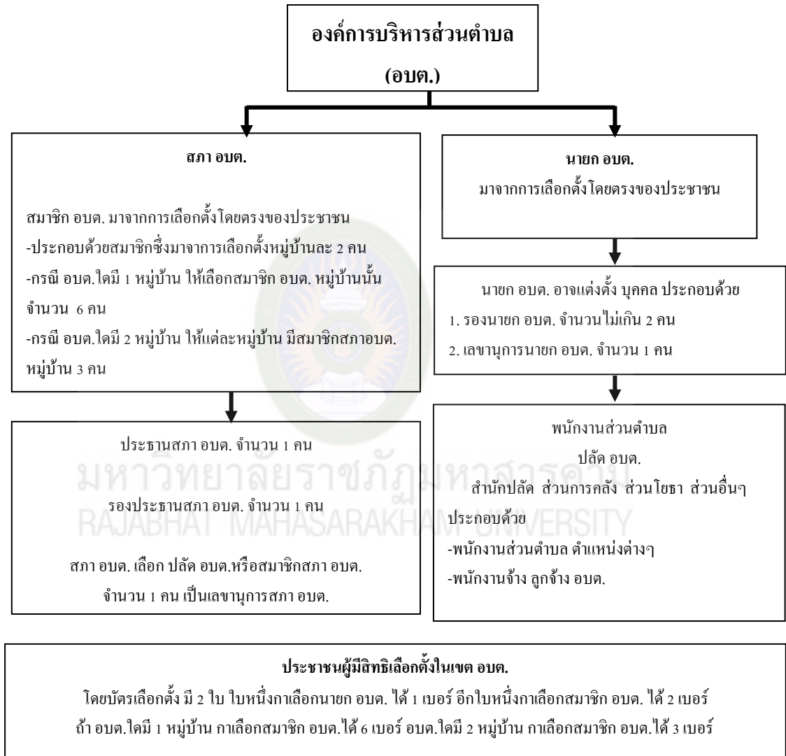
แผนภาพที่ 1 โครงสร้างองค์การบริหารส่วนตำบล

ตำบล (สภา องค์การบริหารส่วนตำบล) และนายกองค์การบริหารส่วนตำบล (นายก องค์การบริหารส่วนตำบล) โครงสร้างของ องค์การบริหารส่วนตำบล ตาม พระราชบัญญัติสภาตำบล และองค์การบริหารส่วนตำบล พ.ศ.2537 แก้ไขเพิ่มเติม (ฉบับที่ 5) พ.ศ. 2546 (โกวิท พงงาม, 2552 : 290)