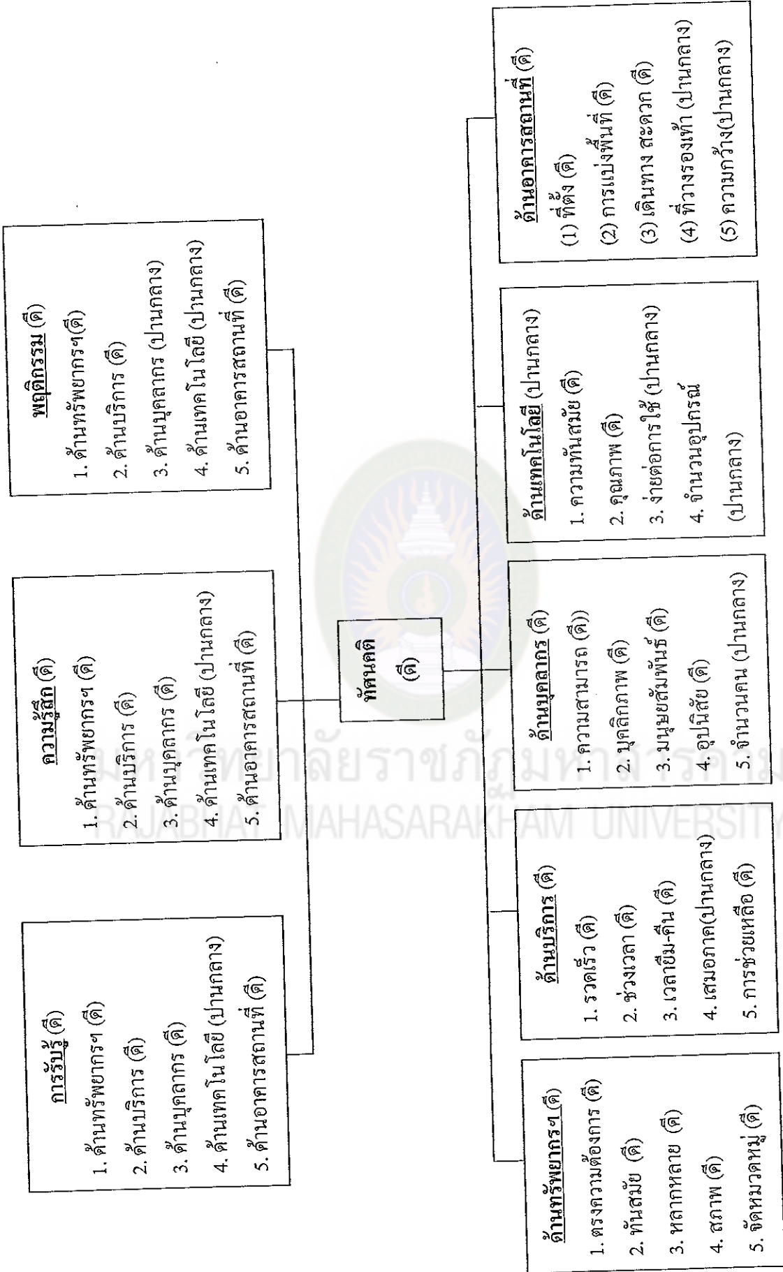
แผนภาพที่ 14 สรุปผลการวัดระดับทัศนคติ