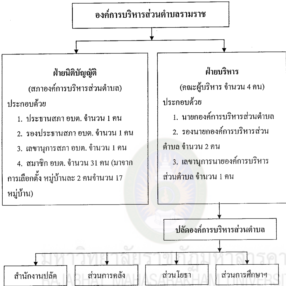
แผนภาพที่ 1 โครงสร้างส่วนราชการองค์การบริหารส่วนตำบลรามราช