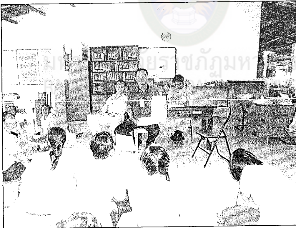
ภาพภาคผนวกที่ 4 ผู้วิจัยกล่าวขอบคุณกลุ่มตัวอย่างหญิงที่ให้ความร่วมมือในการตอบแบบสอบถามครั้งนี้