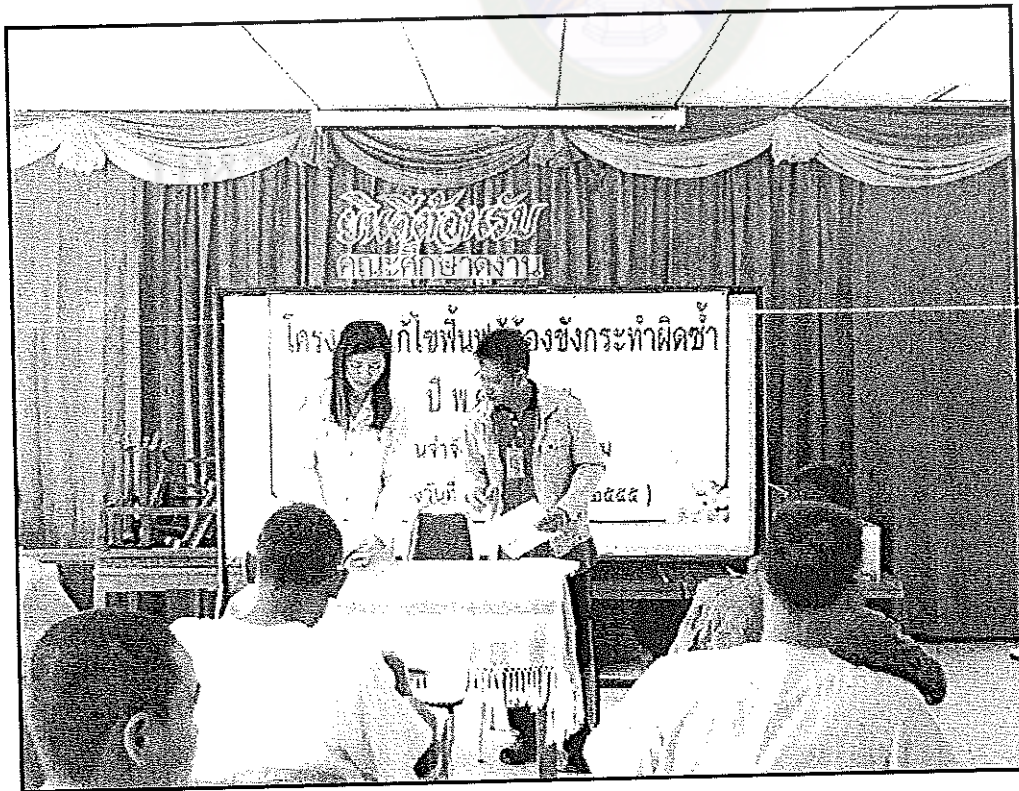
ภาพภาคผนวกที่ 2 ผู้วิจัยกำลังแจกแบบสอบถามให้กับกลุ่มตัวอย่างชาย