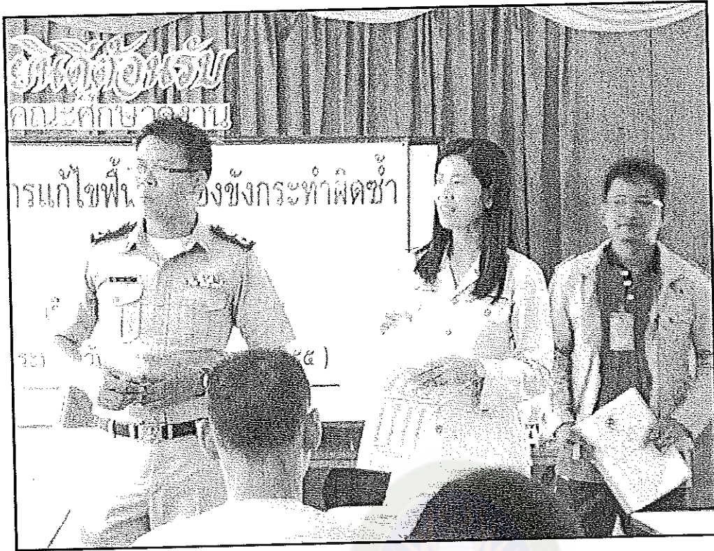
ภาพภาคผนวกที่ 1 ผู้วิจัยชี้แจงวัตถุประสงค์ในการออกแบบสอบถามให้กับกลุ่มตัวอย่างชาย