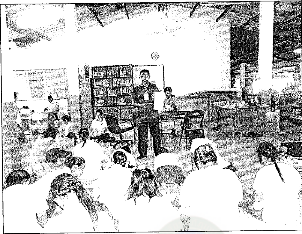
ภาพภาคผนวกที่ 3 ผู้วิจัยชี้แจงวัตถุประสงค์ในการตอบแบบสอบถามให้กับกลุ่มตัวอย่างหญิง