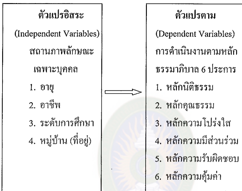
แผนภูมิที่ 3 แสดงกรอบแนวคิดในการวิจัย

จากการศึกษาแนวคิด ทฤษฎีและงานวิจัยที่เกี่ยวข้อง ผู้วิจัยได้ใช้กรอบแนวคิดหลัก ชรรมาภิบาล ตามระเบียบสำนักนายกรัฐมนตรี ว่าด้วยการสร้างระบบบริหารกิจการบ้านเมือง ที่ดี พ.ศ. 2542 มาเป็นกรอบแนวคิดในการวิจัย ดังแผนภูมิที่ 3