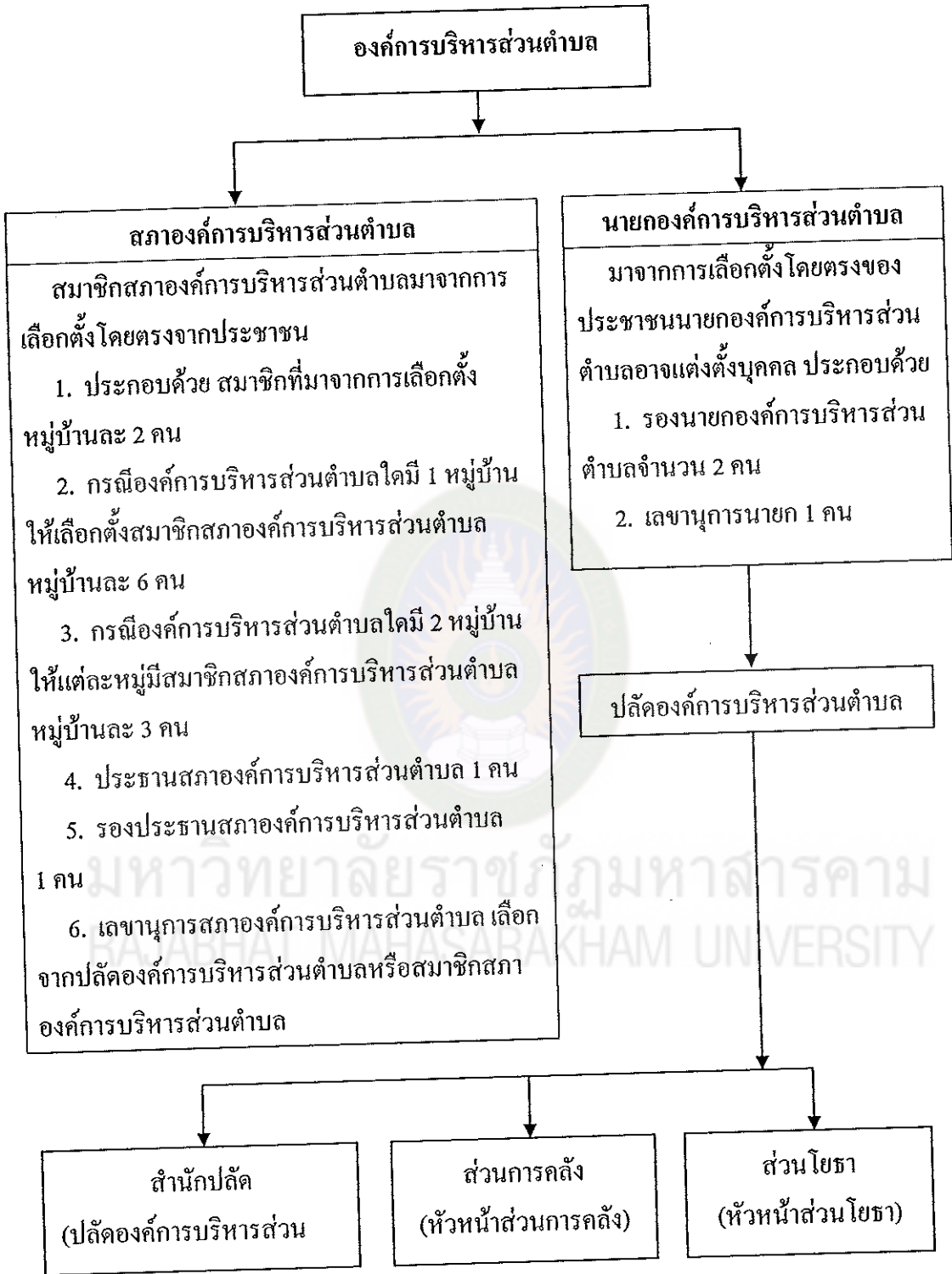
แผนภาพที่ 1 โครงสร้างองค์การบริหารส่วนตำบล