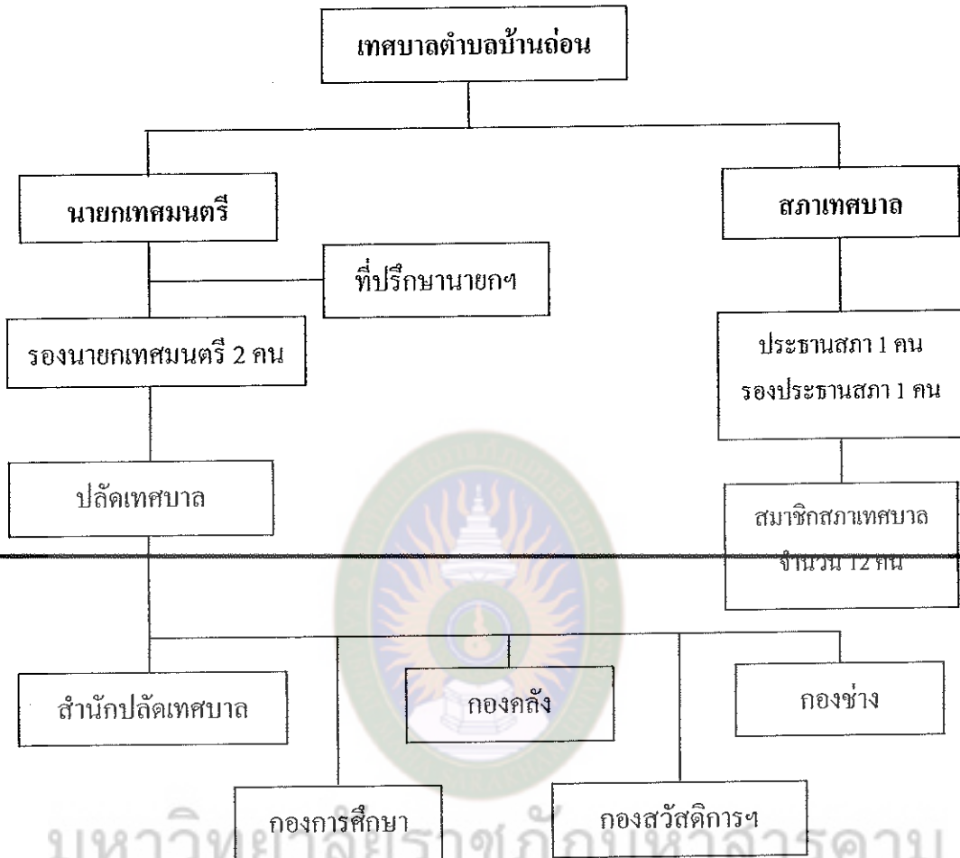
แผนภาพที่ 2 โครงสร้างการบริหารงานเทศบาลตำบลบ้านถ่อน