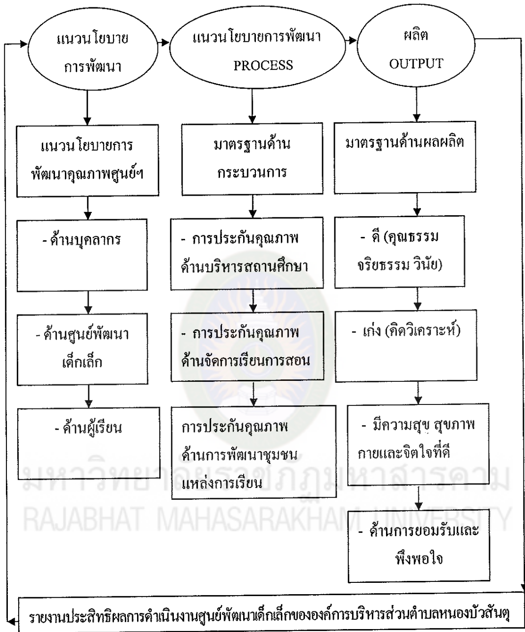
แผนภูมิที่ 2 กรอบแนวคิดการประเมินคุณภาพภายในสถานศึกษาสังกัดองค์กรปกครองส่วนท้องถิ่น