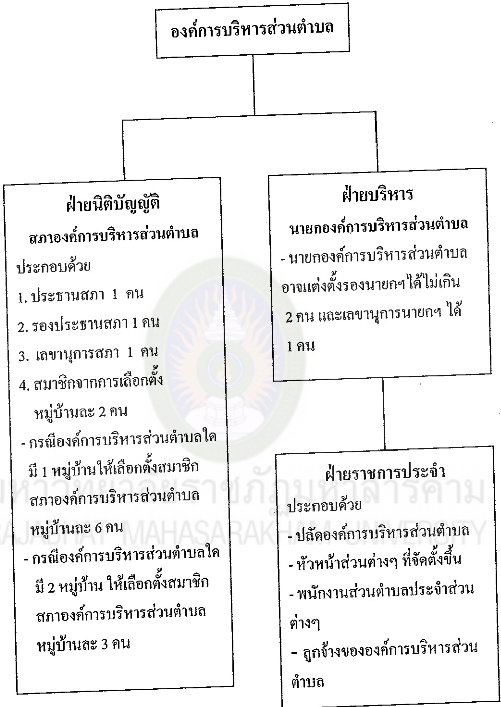
แผนภูมิที่ 1 โครงสร้างองค์การบริหารส่วนตำบล