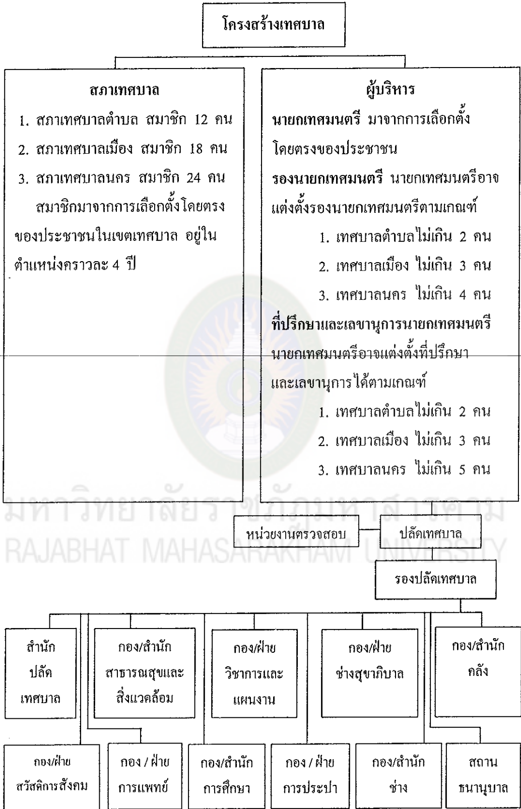
แผนภูมิที่ 2 โครงสร้างของเทศบาล